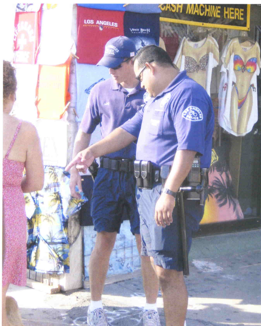
Policía de Los Angeles.

Las críticas al sistema se centran en que a nivel federal (el presidente de la nación) apenas cuenta con el 10% del total de la fuerza y en la dificultad de coordinar sus más de 17.000 fuerzas independientes (en Nueva York coincide la policía de la ciudad con las de otros cinco condados más), además de que cada fuerza está organizada de forma distinta, los reclutamientos son muy diversos (en algunos departamentos no es necesario tener la nacionalidad norteamericana), y a nivel federal no hay ninguna obligación de niveles mínimos policiales