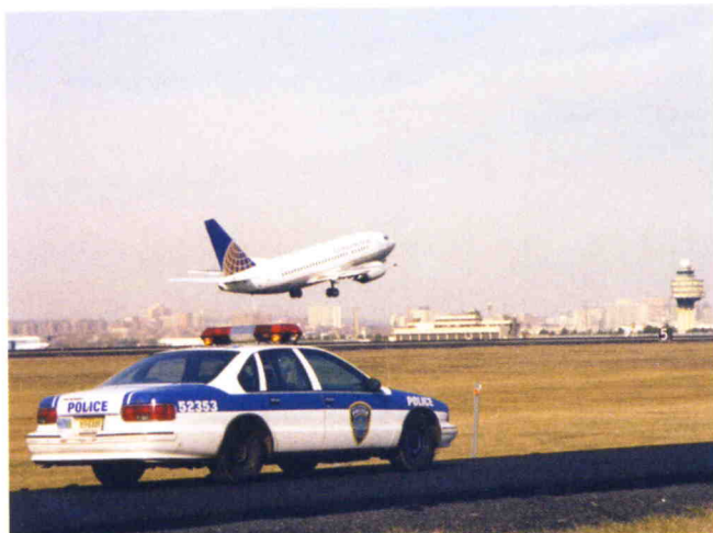
Policía y medios pesados en el aeropuerto de Newark (Nueva York).

Actualmente la Guardia Nacional constituye el 56% del componente activo del Ejército, el 36% de sus fuerzas de apoyo al combate y el 33% de sus servicios logísticos. Sus 346.000 hombres se encuentran encuadrados en ocho divisiones y 15 brigadas. También cuenta con un componente aéreo (Guardia Aérea Nacional), que se encuentra desplegado en 140 puntos con otros 108.000 efectivos. Aunque la Ley Posse Comitatus prohíbe el uso de la Guardia Nacional en misiones policiales, en