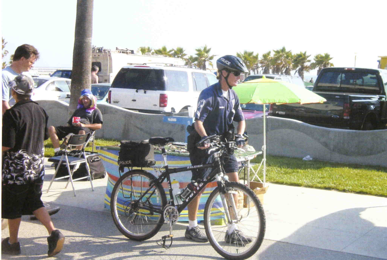
Policía de Los Angeles.

musicales), y la política de contratación de personal civil en sus policías, además de otras ideas para ampliar esta contratación en tareas que nosotros nos resistimos. También están teniendo mucha influencia las consecuencias del 11-S.