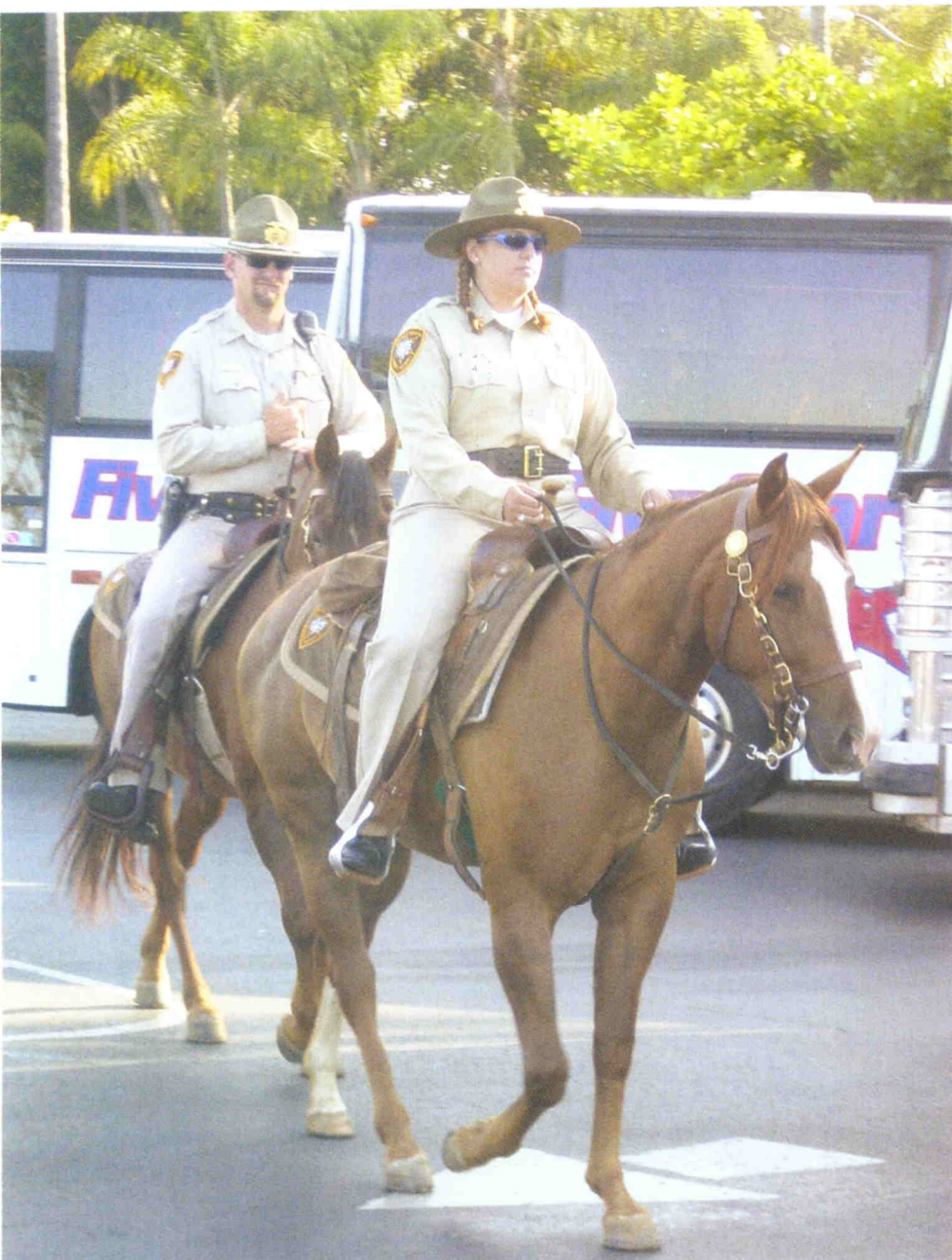
Policía de San Diego.

De este departamento dependen: el Servicio de Inmigración; el Servicio de Aduanas (U. S. Custom Service) que tiene competencias en más de 400 tipos de leyes relacionadas con las aduanas, drogas, control de exportación y fraude fiscal, además de tener competencias en determinadas leyes de navegación; el Servicio Secreto (U. S. Secret Service) que se encarga de investigar delitos financieros, fraudes y especialmente amenazas contra los dignatarios americanos, protección de la Casa Blanca y