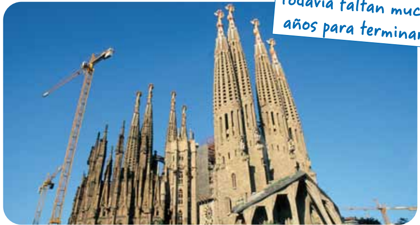
Todavía faltan muchos años para terminarla

Cuando camines por el Barrio Gótico piensa que estás pisando la parte más antigua de la ciudad y quizás por eso, la más bonita. Pasear por sus calles estrechas y pequeñas plazas es muy especial, como si el tiempo se hubiera detenido. Estas calles han vivido un montón de historias y en ellas podemos ver desde restos romanos hasta la increíble catedral, pasando por la plaza de Sant Jaume, la judería o la iglesia de Santa Maria de Pi. La Catedral de la Santa Cruz y Santa Eulalia es el corazón del barrio. Detente un rato a ver esta enorme catedral gótica del siglo XIII. ¿Cómo podían poner esas piedras tan grandes ahí arriba, sin grúas, ascensores ni electricidad? Aunque la catedral es muy antigua, la fachada tiene poco más de 100 años pero también es muy chula. Puedes admirar su claustro, sus capillas y sus fantásticas gárgolas. En el claustro viven trece ocas que simbolizan la edad con la que Santa Eulalia murió.