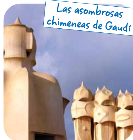
Las asombrosas chimeneas de Gaudí

Obra de Lluís Domènech i Montaner, es quizás uno de los edificios más bonitos del mundo. Además de su moderna estructura, su decoración es apabullante, mires por donde mires, verás detalles y más detalles en sus mosaicos, esculturas, grandes cristaleras, forjados de hierro. ¡Alucinante!