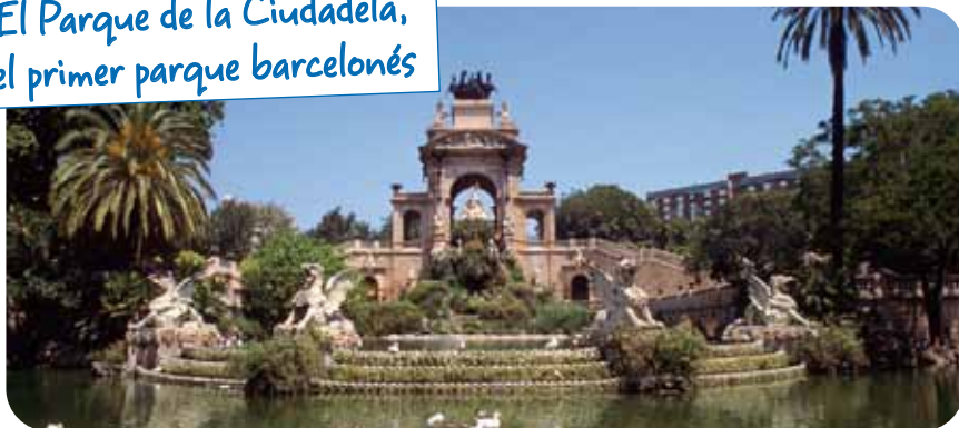
El Parque de la Ciudadela, el primer parque barcelonés