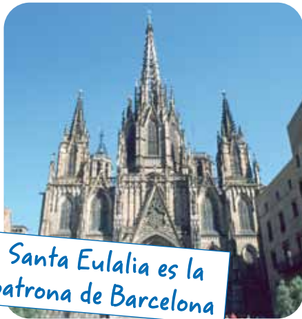
Santa Eulalia es la patrona de Barcelona