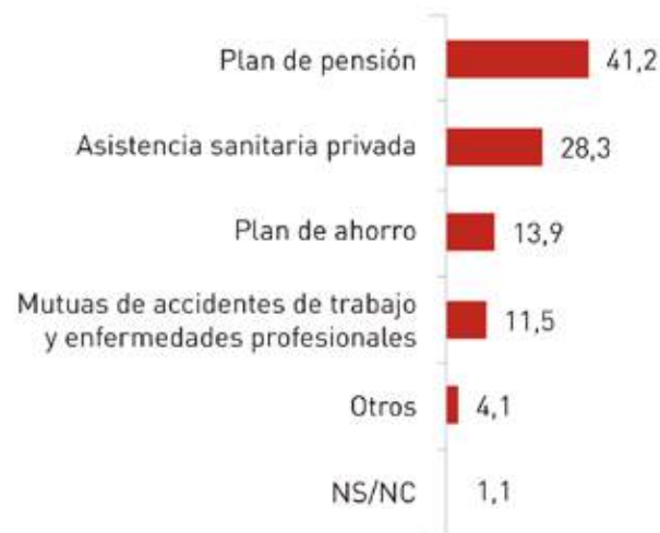
PROPORCIÓN DE LA MUESTRA SEGÚN EL TIPO DE SEGURO/PLAN/OTROS PRIVADOS QUE TIENEN CONTRATADOS PARA CUBRIR LAS NECESIDADES

Así las cosas, un contundente 62,6% de los autónomos de la muestra consideran que el sistema español está por debajo o muy por debajo del que tiene el resto de países europeos. No hay que pasar por alto que en algunos países las cuotas a pagar son más flexibles o más bajas en comparación, pero tampoco que las coberturas son inferiores y, en muchos casos, ligadas a aportaciones voluntarias, incluso algunas coberturas, como la de cese de actividad, que no es obligatoria en ningún otro país y en numerosas ocasiones es una prestación inexistente. Además, como recuerda ATA en el informe, hay que valorar que España es el único Estado en el mundo que