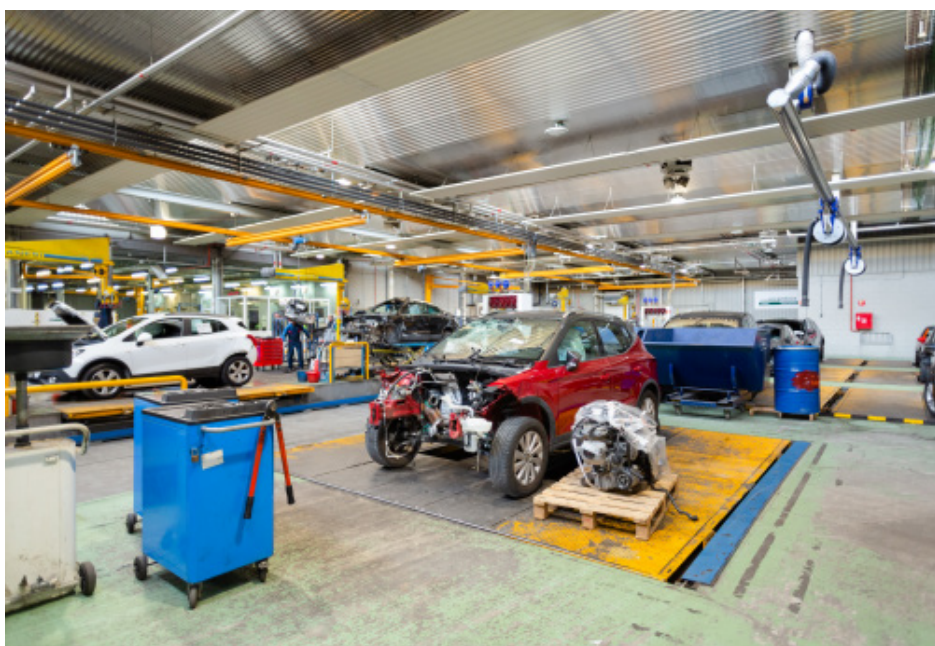
▶ Tratamiento de piezas en el taller de Cesvi Recambios