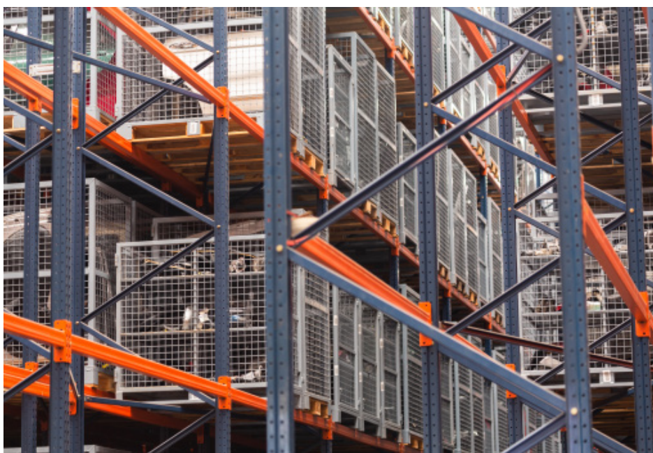
▶ Almacén de 60.000 m 3