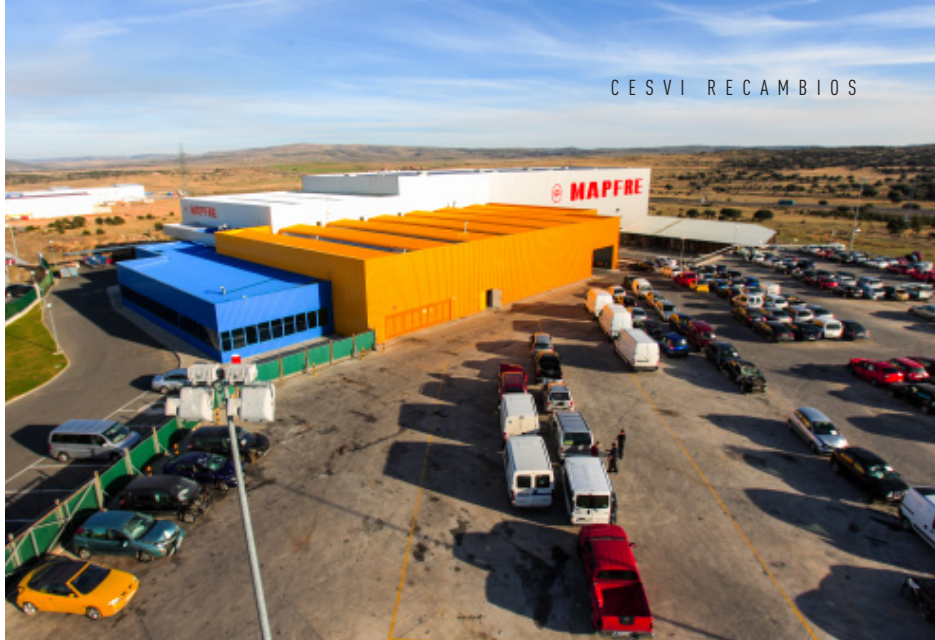
▶ Vista aérea de Cesvi Recambios

La web ofrece también la posibilidad de efectuar una búsqueda avanzada para filtrar los resultados de manera más intuitiva, o seleccionar varios campos al mismo tiempo, acotando con mayor exactitud el recambio demandado. De ese