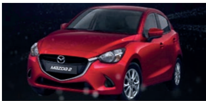
Hasta 55.5 millones Mazda 2