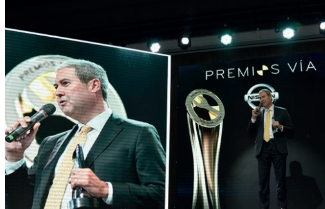
Nissan Kicks recibió el galardón a Mejor costo de reparación en el segmento de Utilitarios.