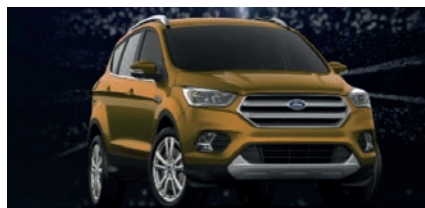
Hasta 140 millones Ford Escape