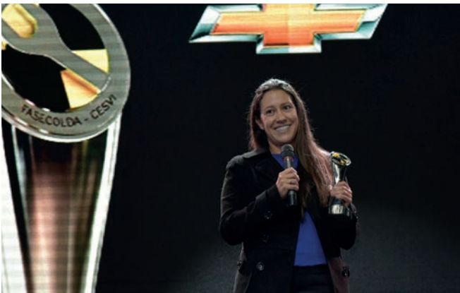
En el segmento de Pickups, Chevrolet D-Max también fue premiada en la categoría Mejor costo de reparación.