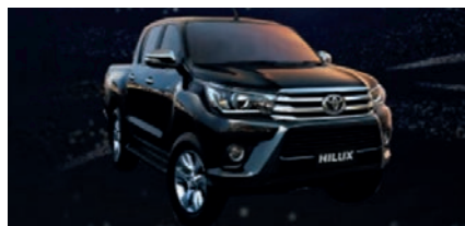
Más de 115 millones Toyota Hilux