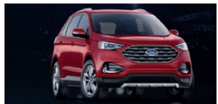
Más de 140 millones Ford Edge