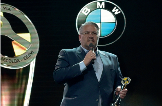
BMW Serie 4 fue uno de los premiados en la categoría Mejor costo de reparación.