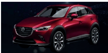
Hasta 80 millones Mazda CX-3