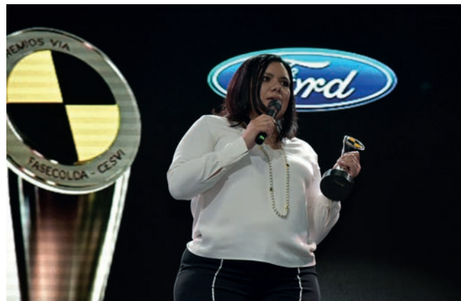
Ford fue la gran ganadora en materia de seguridad.