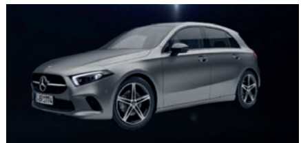
Más de 73 millones Mercedes Benz Clase A