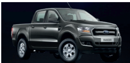
Hasta 115 millones Ford Ranger