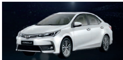
Hasta 73 millones Toyota Corolla