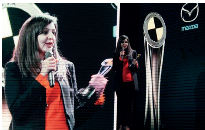
El Mazda 2 y la CX-3 hicieron a la marca acreedora de dos galardones en la categoría Mejor equipamiento en seguridad.