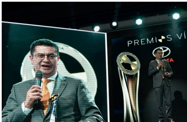
Toyota también se llevó los galardones a Mejor costo de reparación por su Toyota Hilux y Toyota Prado.