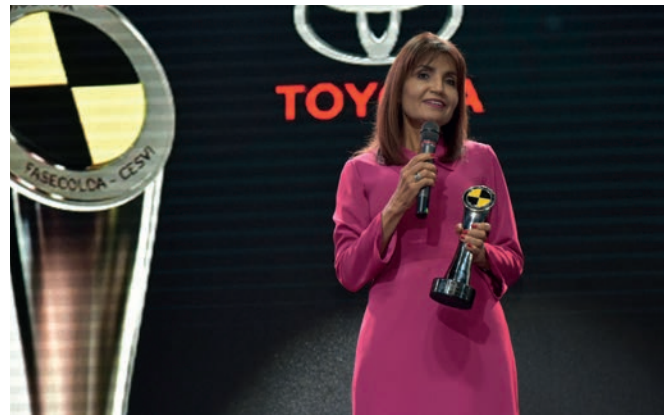
En la categoría Automóviles de hasta 73 millones, Toyota Corolla recibió un galardón por su equipamiento en seguridad.