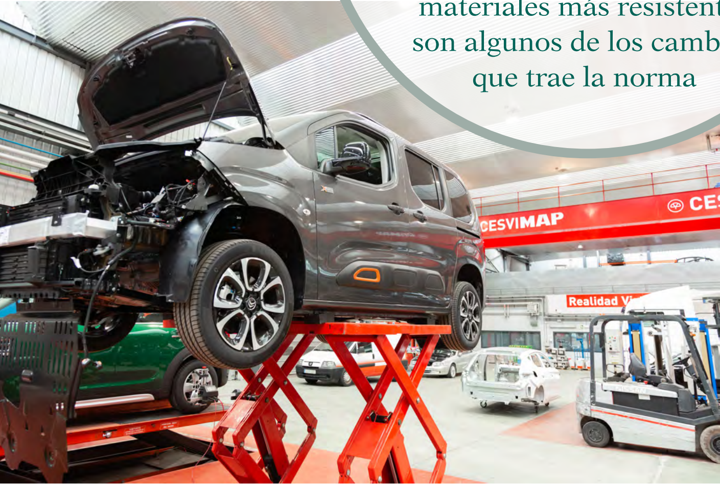
Elevadores. Elementos críticos en la seguridad del taller

Bloqueos más seguros, cables más fiables, materiales más resistentes son algunos de los cambios que trae la norma