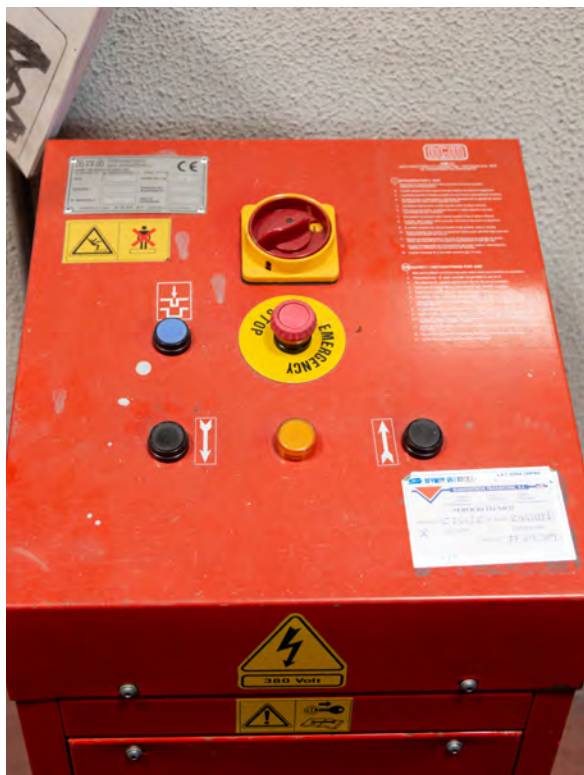
Advertencias de seguridad sobre el equipo