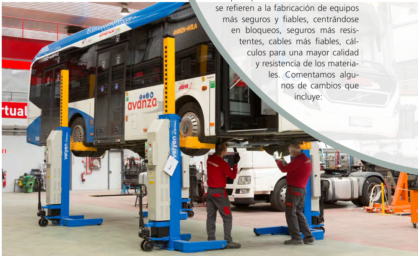
La norma aplica a los elevadores debajo de los cuales se permanezca

Los principales cambios de la norma se refieren a la fabricación de equipos más seguros y fiables, centrándose en bloqueos, seguros más resistentes, cables más fiables, cálculos para una mayor calidad y resistencia de los materiales. Comentamos algunos de cambios que incluye: