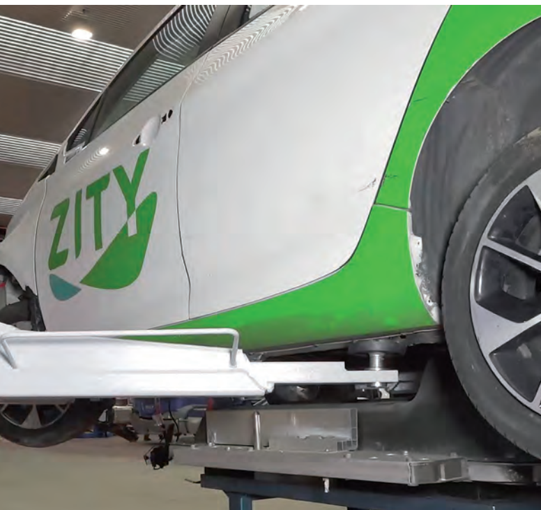
Mayor seguridad anticáida para elementos como y soportes

Los elevadores incluyen numerosos elementos de riesgo, por lo que su construcción, instalación, mantenimiento y uso están sometidos a criterios de seguridad.