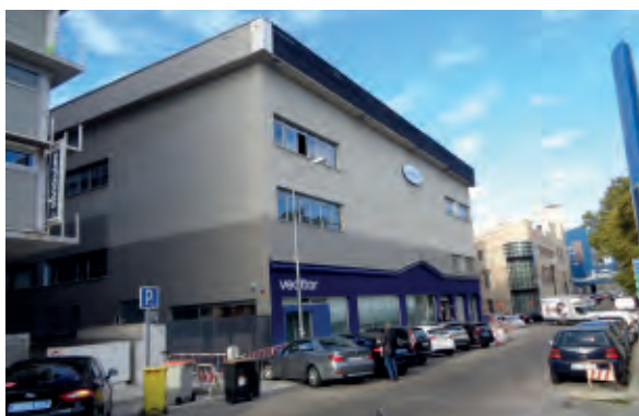
Taller propio de la base de operaciones de una compañía de VTC