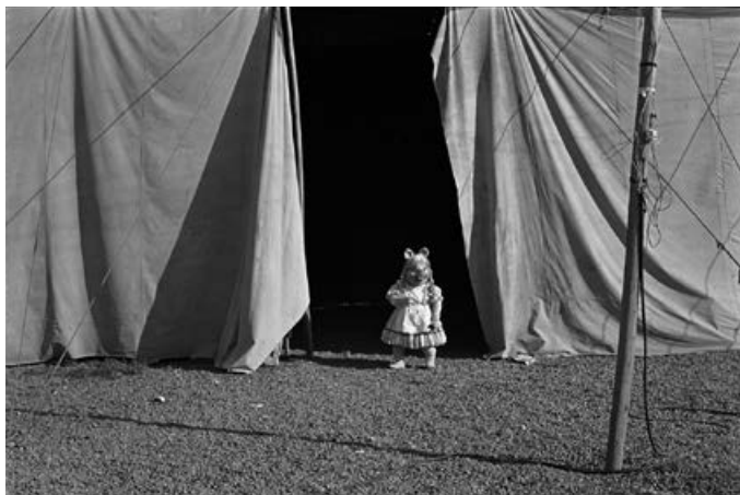
Miss Piggy II, Santiago, de la sèrie El circ, 1984

la qual cosa va dur a la persecució i les desigualtats econòmiques i socials de bona part de la població civil. Segons les xifres de l'Instituto Nacional de Derechos Humanos de Xile, les víctimes de la dictadura de Pinochet superen les 40.000 entre assassinats, torturats i desapareguts.