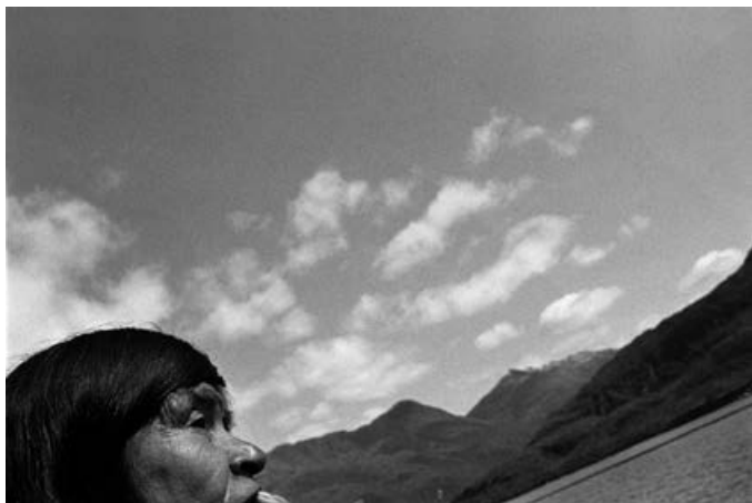
Atáp, Ester Edén Wellington, Puerto Edén, de la sèrie Els nòmades del mar, 1995

qui d'alguna manera eren ignorats pel règim. La carrera de l'artista s'ha desenvolupat sempre al seu país d'origen. En les seves imatges, fortament compromeses, l'autora vol donar veu a aquells que no acostumen a ser escoltats. Fotografia espais en els quals predomina la marginació i el tancament, però els personatges que hi habiten es presenten sempre des de la confiança i el respecte mutu. De manera continuada, Errázuriz ha triat temes i ha retratat individus situats al marge del discurs hegemònic i de l'oficialitat. Entre d'altres, les seves sèries són poblades d'ancians, infants, malalts mentals, prostitutes, transvestits o nadius americans. En les seves imatges, l'autora mostra permanentment una forta consciència social com a fotògrafa, una gran rellevància de l'actitud ètica davant del món, i un profund sentit del respecte i de la proximitat envers les persones retratades i els assumptes que l'han preocupat. Un interès que amb el temps ha mantingut i fins i tot intensificat aquesta convivència amb els seus retratats, tal com mostra l'ampli corpus de treball que ha desenvolupat al llarg de tota la seva trajectòria.