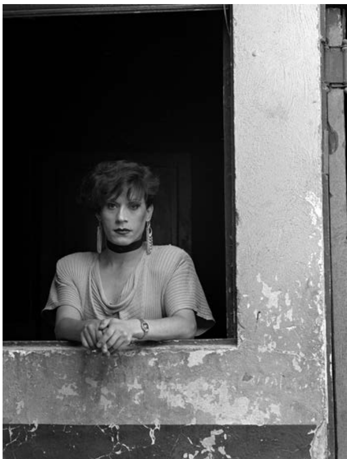
Evelyn IV, Santiago, de la sèrie La Poma d'Adam, 1987

L'any 2018, després d'haver organitzat la primera retrospectiva de l'artista a Espanya, Fundación MAPFRE incorporava 175 obres de la fotògrafa xilena Paz Errázuriz (Santiago de Xile, 1944) als seus fons. L'exposició que ara es presenta al Centre de Fotografia KBr de Barcelona està constituïda per una acurada selecció d'aquestes fotografies i inclou algunes de les seves sèries més conegudes, com La poma d'Adam o L'infart de l'ànima , juntament amb d'altres de les seves obres més representatives, des dels anys setanta fins a l'actualitat.