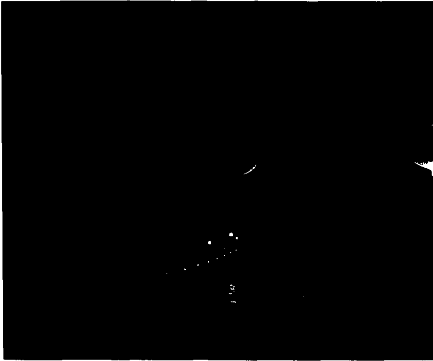
Vista nocturna del viejo San Juan.

rió el 11 de octubre de 1918. Su epicentro estuvo localizado al noroeste de Aguadilla, en el cañón de la Mona. Este sismo tuvo una magnitud aproximada de 7.5 en la escala Richter y fue acompañado por un maremoto cuyas olas llegaron a alcanzar seis metros de altura. Los daños se concentraron en el área oeste de la isla, la zona más cercana al epicentro.