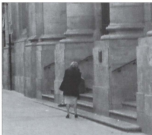
En el año 2000 el 17 % de la población española corresponde a personas mayores de 65 años.

asegurador no permanece impassible ante estos cambios que, sin duda alguna, van a modificar la manera de percibir el conjunto de la sociedad. No podemos volver la espalda a un segmento de población que, en los países desarrollados, va a representar un porcentaje más que apreciable respecto al conjunto de la misma. Por ello, hemos querido llamar la atención sobre este asunto que, sin duda alguna, dará mucho qué hablar en los próximos años. Estos datos tan recientes de la evolución demográfica de la población española, son la base de un trabajo de investigación que será publicado próximamente en los ANALES del IAE. ■