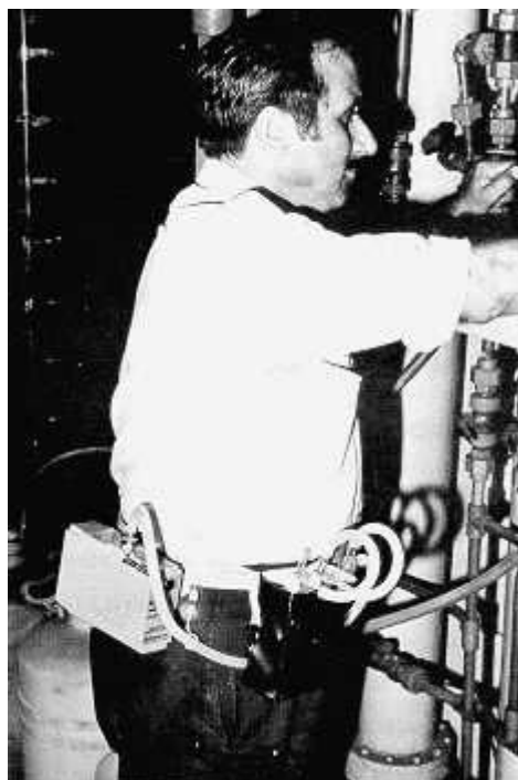
Fig .3: Toma de muestra con impinger

Preparar para cada lote de muestras un "impinger blanco". Este impinger, tapado perfectamente, contendrá la misma solución absorbente y volumen que las muestras, y habrá seguido sus mismas manipulaciones, exceptuando el paso de aire a su través. Etiquetarlo con la palabra Blanco.