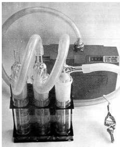
Fig. 2: Equipo de muestreo