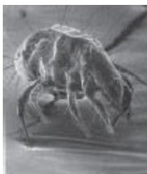
Figura 4 Yrophagus putrescentiae