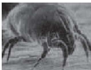
Figura 7 Dermatophagoides pteronyssinus

Muy frecuente y abundante en domicilios (colchones, almohadas, alfombras y textiles en general) ( figura 7 ).