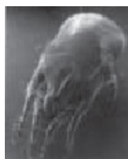
Figura 8 Dermatophagoides farinae

En España es muy abundante en las provincias mediterráneas ( figura 8 ).