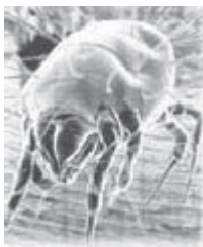
Figura 6 Blomia tropicalis

Su ubicación habitual es en productos almacenados y polvo doméstico. Está presente en Canarias, Cataluña y Andalucía y constituye la principal causa de enfermedades alérgicas como asma, rinitis y dermatitis atópica ( figura 6 ).