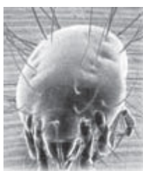
Figura 3 Sarcoptes scabiei

Se ha descrito tradicionalmente como causa de enfermedades alérgicas (asma bronquial, rinoconjuntivitis) en avicultores, así como en personas expuestas a ambientes donde se almacenaban alimentos y piensos. Sin embargo, en los últimos años se han citado numerosos casos de alergia en otros ambientes, especialmente domésticos.