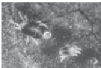
Figura 11 Tetranychus urticae

Causante de alergia ocupacional en trabajadores de hortalizas y flores, con especial repercusión entre los trabajadores de invernadero ( figura 11 ).