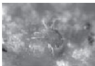
Figura 10 Panonychus citri

Causante de patología ocupacional en trabajadores de cítricos, con especial repercusión en el área levantina de España ( figura 10 ).