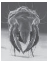
Figura 5 Acarus siro

Puede causar síntomas alérgicos en personas que trabajen con los productos contaminados, tanto por inhalación como por contacto.