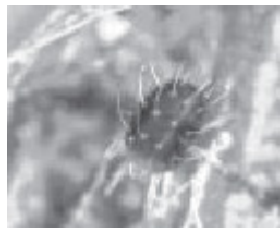
Figura 9 Panonychus ulmi

Es un ácaro que parasita frutales de la familia de las rosáceas y ha sido descrito como causante de alergia ocupacional en recolectores de estas frutas ( figura 9 ).