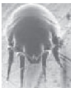
Figura 12 Chortoglyphus arcuatus

Es abundante en polvo de granjas, graneros y almacenes; también está presente en polvo doméstico. Es bastante común en el litoral. Se le ha encontrado en la cornisa cantábrica, Andalucía, Baleares, Castilla y León, Canarias y Cataluña. Se han detectado casos de sensibilización en pacientes, especialmente en granjeros, en contacto con productos contaminados ( figura 12 ). Tiene reactividad cruzada baja con Dermatophagoides pteronyssinus .