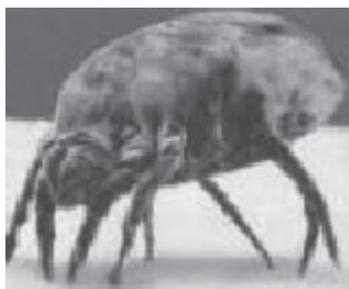
Figura 13 Glycyphagus domesticus

destructor y Tyrophagus putrescentiae , y baja con Dermatophagoides pteronyssinus y Acarus siro .