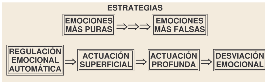
Figura 2 Estrategias individuales de control de las emociones

emociones que está sintiendo el empleado), más efectos perjudiciales provoca tanto para el empleado como a la larga para la organización.