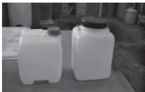
Envases de 10 litros