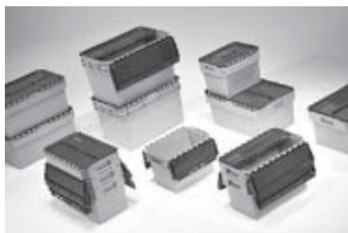
Cajas de reactivos