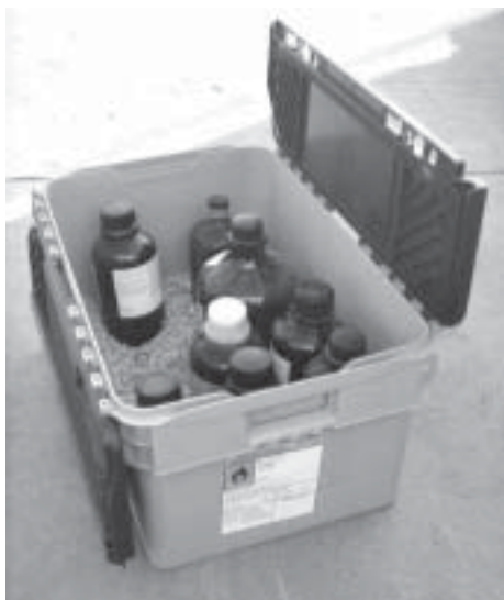
Se observa la colocación de las botellas de reactivo, el absorbente para casos de derrame, y la etiqueta.

En el caso de los residuos que sean reactivos de laboratorio, contenidos en su propio envase o en otros, y que estén almacenados en cajas de polietileno estancas (ver figura 3), ha de procurarse no superar los 20 Kg. por caja, incluido el absorbente interior para derrames (que debe añadirse), e intentar, dentro de lo posible, separar los residuos en cajas diferentes, de acuerdo con su clasificación y considerando las posibles incompatibilidades. Los envases han de estar fijos de manera que no se puedan mover, incluyéndose, adherido a cada caja, un listado de los residuos y volúmenes que contiene, facilitando, así, la detección de incompatibilidades por parte del gestor externo, durante la recogida.