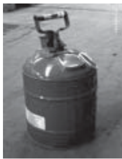
Envase de seguridad