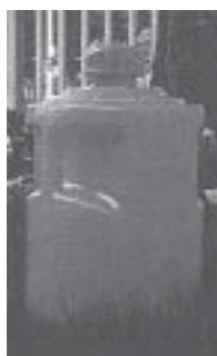
Envase de 25 litros