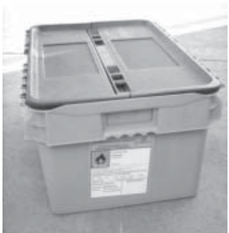
Caja preparada para su almacenamiento a la espera de la recogida por parte del gestor.