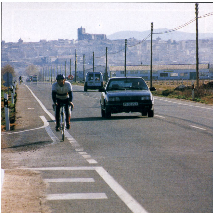
Al adelantar vehículos de dos ruedas, la separación lateral mínima será un metro y medio

Circular detrás de un camión cuando el pavimento está mojado puede hacer perder casi por completo la visibilidad del conductor que le sigue debido a la gran cantidad de agua que levantan las ruedas de estos vehículos. También en estos casos debe aumentarse la distancia de seguridad para ver mejor en la distancia, adelantando únicamente cuando el camino se encuentre despejado y con el limpiaparabrisas barriendo el agua a la máxima velocidad.