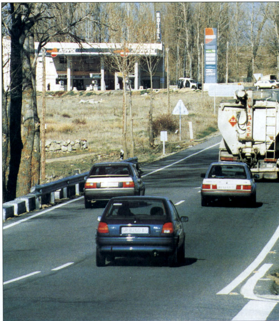
La distancia de seguridad antes de iniciar la maniobra se aumentará para disponer de una visibilidad suficiente sobre la vía

E l adelantamiento es la maniobra más peligrosa que puede realizarse durante la conducción, por ello, es de suma importancia respetar las normas y evaluar las posibilidades de un adelantamiento sin riesgo para no poner en peligro nuestra seguridad y la de los demás usuarios de la vía.