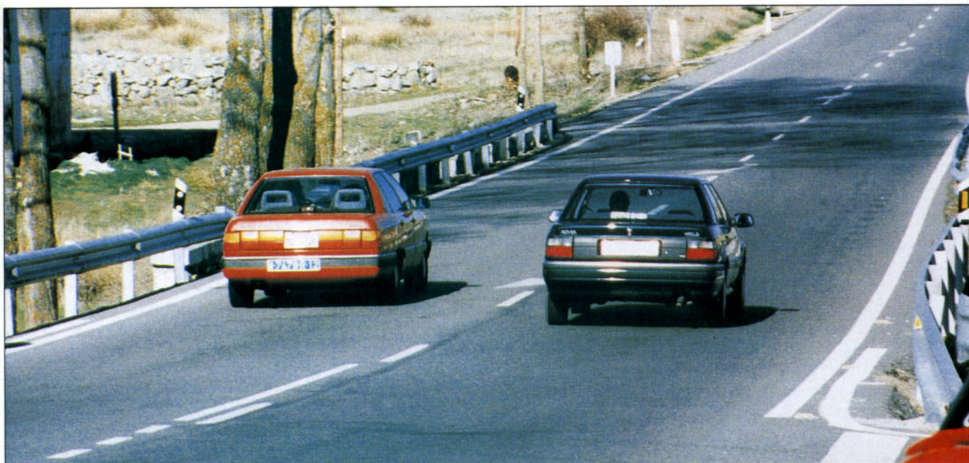
La separación lateral entre vehículos será aquella que permita realizarlo con seguridad

la separación será aquella que deje realizar la maniobra con seguridad.