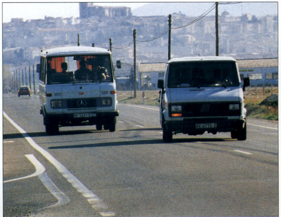
El retorno al carril derecho deberá ser gradual para no modificar la velocidad ni la trayectoria del vehículo adelantado

En cuanto a la separación lateral mínima que debemos dejar al adelantar a vehículos de dos ruedas, peatones y vehículos de tracción animal, el código de la circulación establece un metro y medio, que con vendrá aumentar siempre, si la vía y el tráfico lo permiten. Para el resto de vehículos,