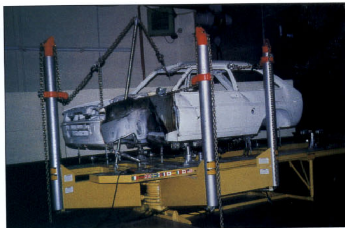
Ejecución de tiros múltiples sobre una carrocería.

Puede emplearse para el mismo fin el medidor universal Dimension III, basado en la comparación de puntos simétricos de la carrocería, que, como las dos opciones antes señaladas, permite comprobar el estado de la estructura del vehículo.