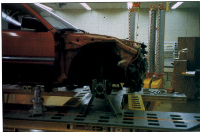
Sistema de anclaje universal.