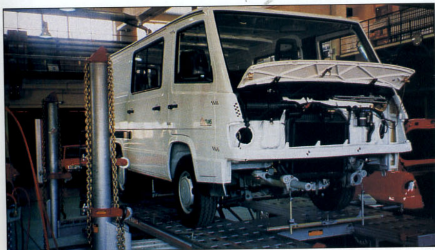
Aplicación en la reparación de un vehículo industrial ligero.

Como consecuencia de las pruebas y estudios realizados, se establecen las siguientes conclusiones: