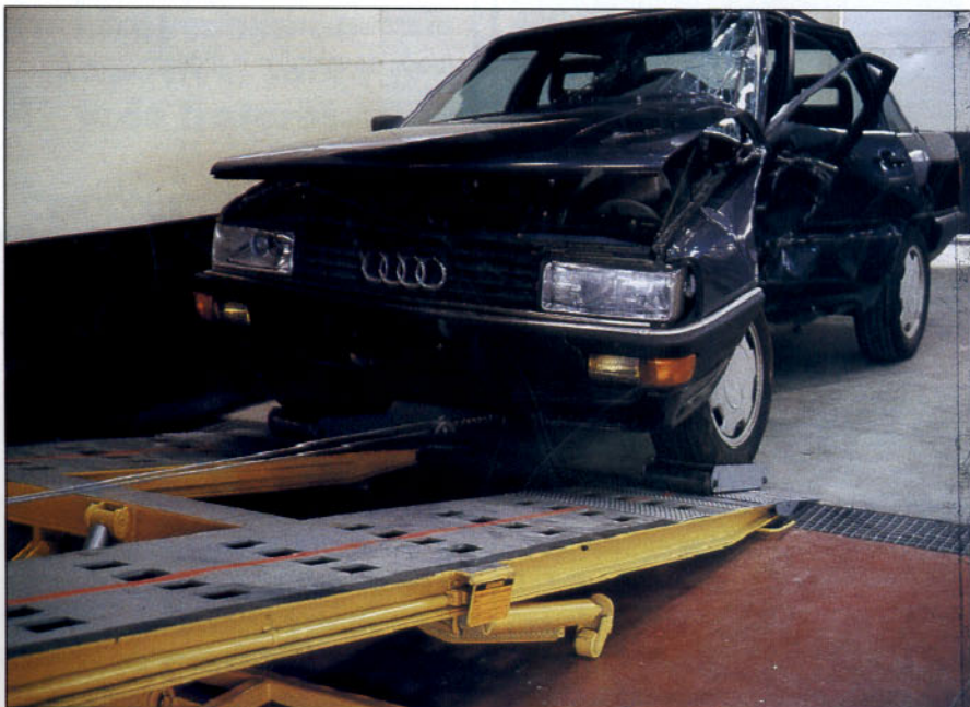
Subida del vehículo a la bancada.

El sistema de anclaje universal consta de cuatro unidades de fijación o mordazas, que son fijadas a la plataforma por medio