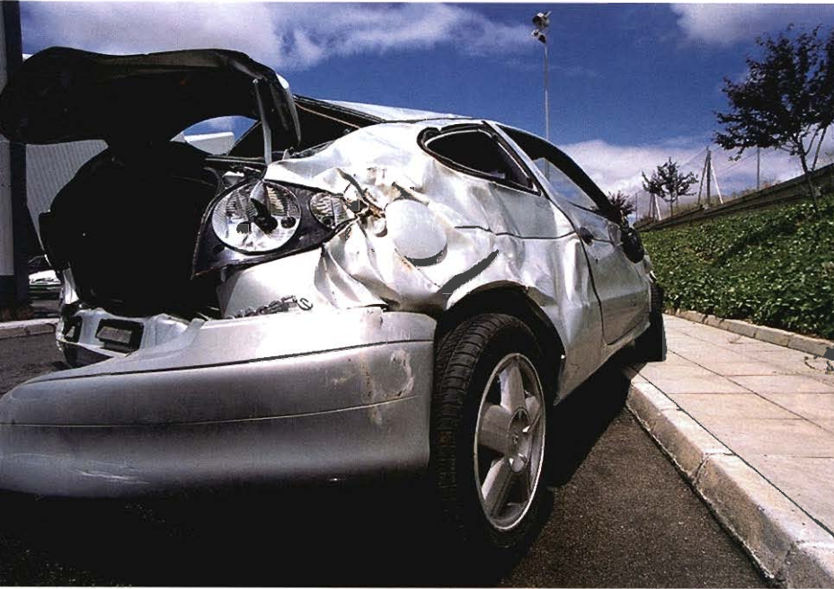
La tipología y magnitud de la deformación de los vehículos aporta gran información para la investigación del accidente