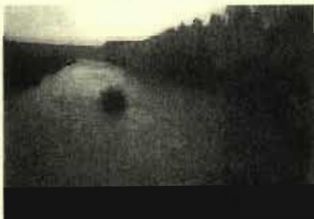
El río Cinca a su paso por Monzón.