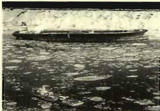
Imagen del petrolero encallado.

WASHINGTON.- Un carguero con 102.000 barriles de hidrocarburos, petróleo bruto y gasóleo, ha encallado tras ser golpeado por un bloque de hielo mientras que estaba descargando en una refinería de Alaska. 34 personas se encuentran a bordo del petrolero, aunque el accidente no ha causado ninguna víctima