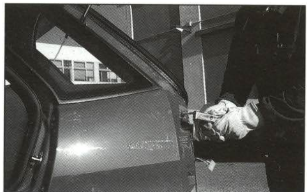
FIGURAS 5 y 6.—Desmontaje aleta sin retirar luna de custodia.