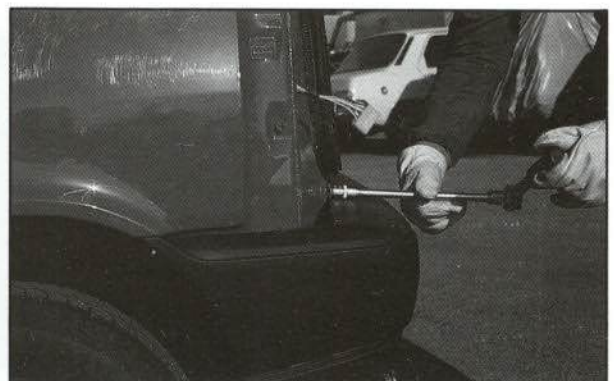
FIGURA 4.—Desmontaje paragolpes.