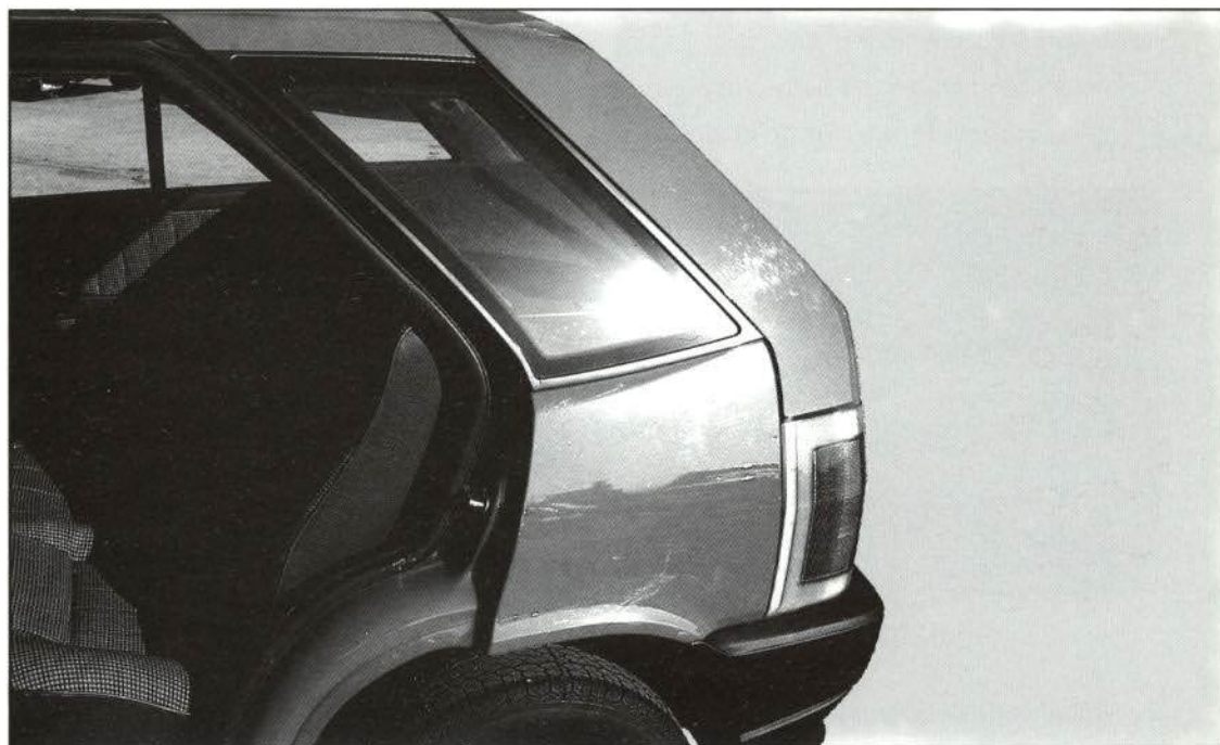
FIGURA 1.—Aleta trasera FIAT TIPO.

Una de las principales novedades que conviene destacar en este vehículo es la forma en la que van fijadas las aletas traseras a la carrocería mediante 4 tornillos y sellador, en todo su contorno. En este Boletín se explican dos procedimientos que pueden seguirse para realizar esta sustitución, con los tiempos empleados en cada uno de ellos, y que han sido ensayados en el taller experimental de CESVIMAP.