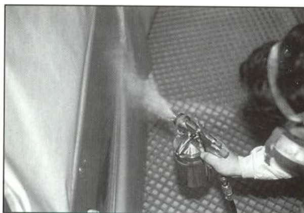
Figuras 3a, 3b y 3c. —Movimiento de la pistola para la realización del difuminado.

Esta última capa difuminada unificará el color entre la zona que se está pintando y la capa de pintura antigua, de tal forma que sea indetectable el cambio de tonalidad que pudiera existir.