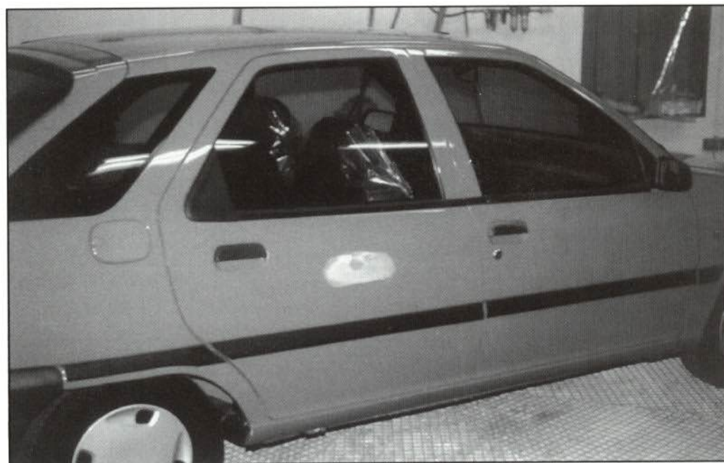
FIGURA 1.—Zona dañada a reparar mediante técnicas de difuminado.

En este boletín se describen las dos principales técnicas de difuminado que se emplean en la realización de parches, y en un próximo boletín se explicará el proceso a seguir en casos concretos de trabajos de repintado.