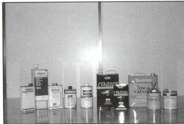
Figura 4.—Productos utilizados para difuminados sobre superficie húmeda.

Esta técnica es aconsejable para pintores con escasa experiencia en la realización de difuminados, ya que reduce, en gran medida, el riesgo de que aparezcan «aureolas» alrededor de la zona reparada.