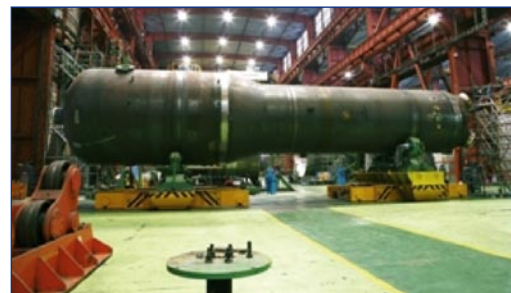
Generador de vapor

Por otra parte, se ha efectuado el embarque de un generador de vapor para la central de Hainan, en China, del mismo modelo que los entregados anteriormente por ENSA para Qinshan, también en China. Este generador de vapor forma parte de un pedido de la empresa Shanghai Electric Nuclear Power Equipment (SENPEC) que incluye el suministro de partes de otros generadores idénticos y asistencia técnica para su fabricación en sus instalaciones. SENPEC entregará el generador a Hainan Nuclear Plant Equipment Co., titular de la central. ENSA fabrica actualmente otros dos genera-