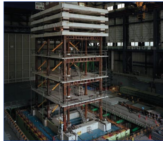
Instalación de ensayo de terremotos