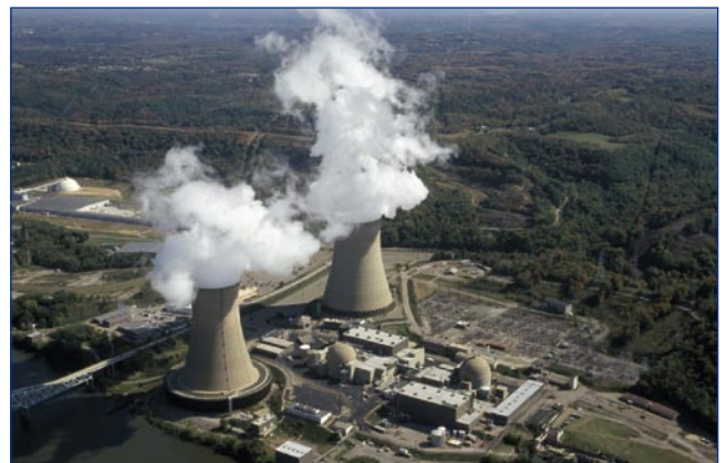
Central nuclear de Beaver Valley

La empresa FirstEnergy Nuclear Operating Co. (Fenoc) ha contratado con Transnuclear el suministro de hasta 53 contenedores para almacenamiento en seco de combustibles usados para su central de Beaver Valley, en Pennsylvania, comenzando por la unidad 1, cuya piscina de desactivación quedará completamente llena en 2015, según confirmó una portavoz de la empresa en una entrevista el 18 de septiembre.