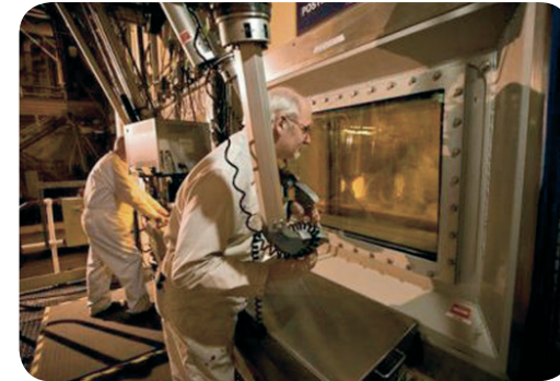
Trabajadores monitorizan el relleno de bidones con refinados de cemento.

Ha terminado en Gran Bretaña la retirada de los refinados procedentes del reproceso del combustible usado en el Reactor de Prueba de Materiales de Dounreay, dentro del programa de desmantelamiento de instalaciones nucleares experimentales antiguas en el país.