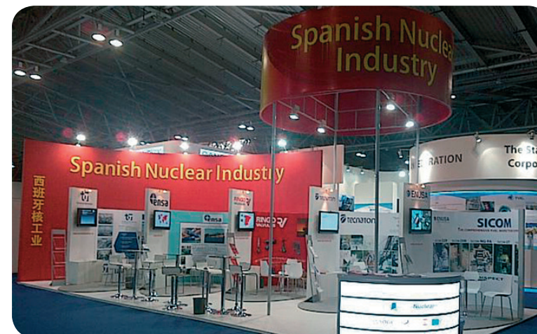
El pabellón español en Shanghai (© Foro Nuclear).

Fuentes: Foro Nuclear, mayo 2013 e IAEA-Pris, junio 2013