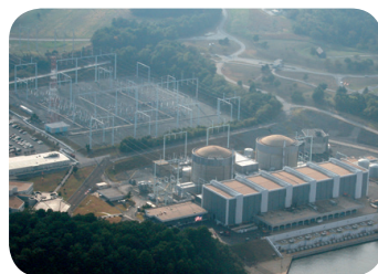
Central nuclear de Calvert Cliffs (© prn.fm).

La industria nuclear estadounidense considera anacrónica en esta época de globalización la prohibición de que empresas extranjeras “posean, controlen u operen” centrales nucleares en EE UU, establecida en la Ley de Energía Nuclear de 1954. En este sentido, considera positivamente la iniciativa de la Comisión Reguladora Nuclear (NRC) de conside-