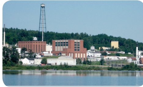
Chalk River (© Wikimedia).

Las labores de desmantelamiento y gestión de residuos radiactivos en las instalaciones antiguas de Canadá, que constituyen la “herencia” de los trabajos de investigación y desarrollo anteriores al