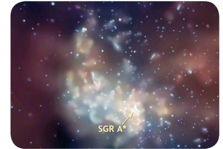
Agujero negro Sagitario A* (www.nasa.gov).