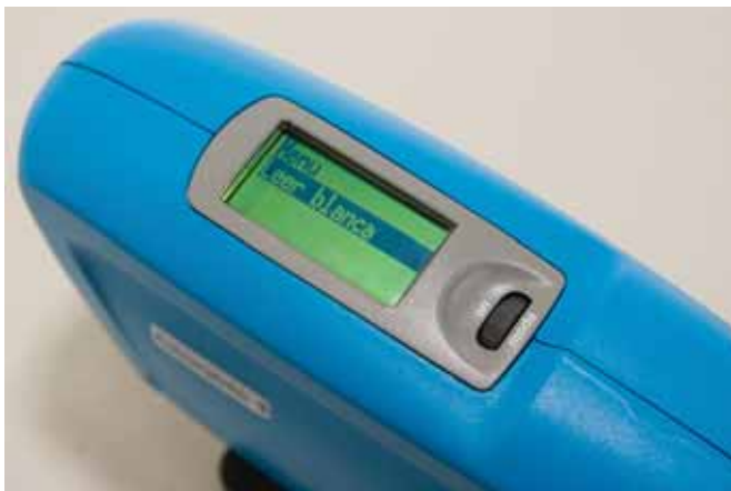
► Calibración blanca (reflectancia 100%)