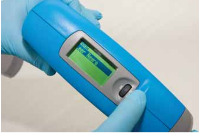
► Calibración negra (reflectancia cero)