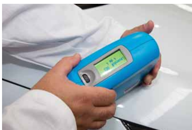
► Secuencia de las cuatro lecturas

Es necesario realizar cuatro medidas. Entre cada una de ellas se recomienda desplazar el aparato y variar su orientación para que se puedan detectar los efectos especiales de los acabados metalizados y perlados.