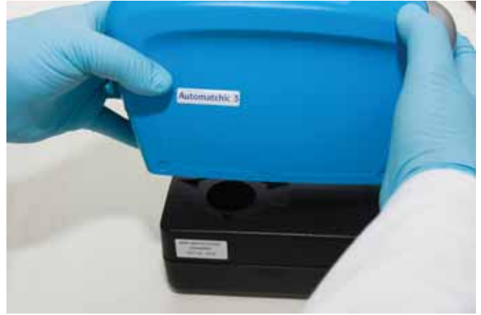
► Caja de calibración negra