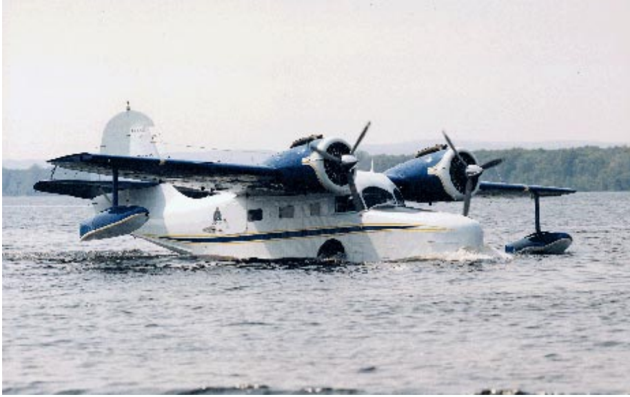
SERVICIO AEREO. Fundado en 1932, cuando la Fuerza Aérea canadiense le prestaba sus aparatos, en la actualidad hacen 3.600.000 millas anuales, lo que supone 25.000 horas de vuelo. Su flota cuenta con 19 aparatos de ala fija (Westwind I, Cessna, Twin Otter y Super Air King) y 9 helicópteros Bell 206 y su plantilla es de 79 pilotos.