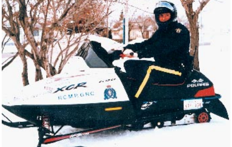
PARQUE MOVIL. Unas 500 motonieves cuenta su parque móvil, de un total de 8.000 vehículos