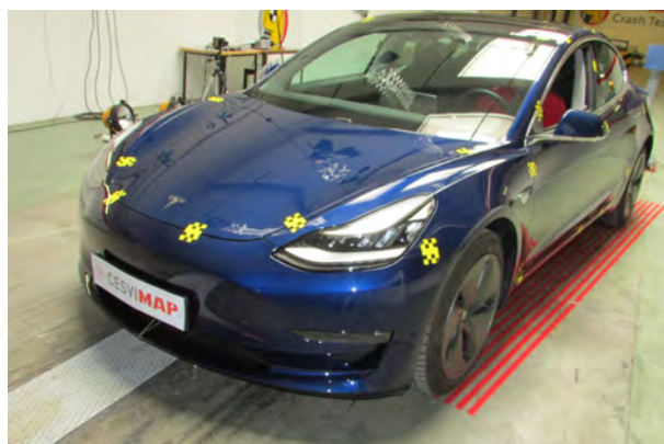
Antes del crash test CESVIMAP

to que solo son útiles cuando existen energías en un accidente que provocan que nuestro cuerpo colisione contra partes rígidas del vehículo. No es el caso. A esa velocidad no existe energía suficiente para que un airbag nos tenga que proteger. Además, su propio despliegue puede ser negativo, por su gran velocidad de inflado y posibilidad de que nos golpee. Hace años este era un hándicap de muchos fabricantes, pero prácticamente todos han