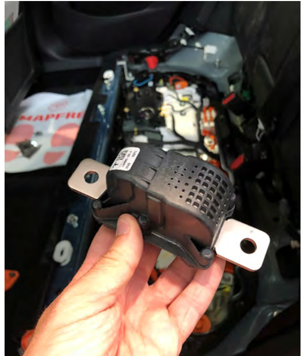
Disyuntor pirotécnico del circuito de HV