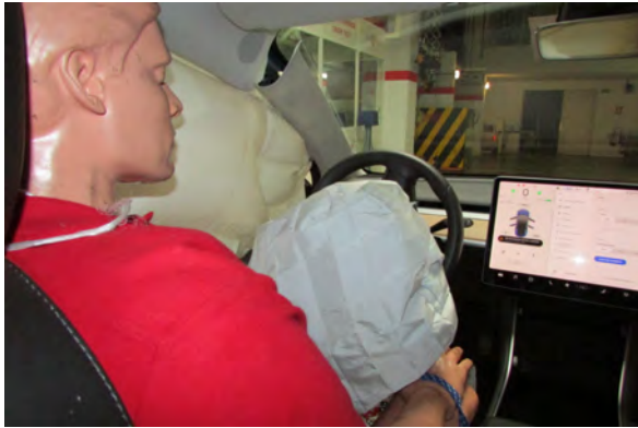
Airbag del conductor