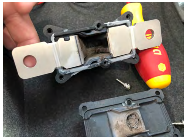
Disyuntor pirotécnico de alta tensión, activado