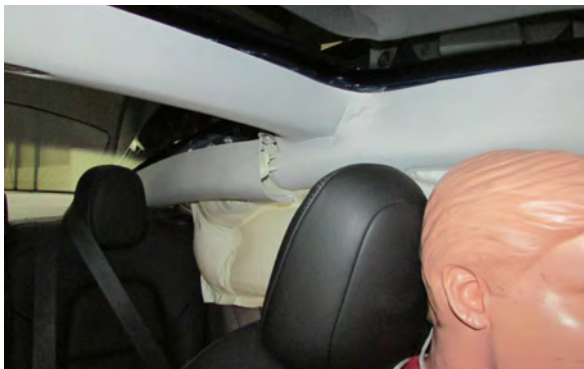
Rotura de molduras del lado izquierdo

ajustado sus umbrales de disparo para descartar este tipo de accidentes menores.