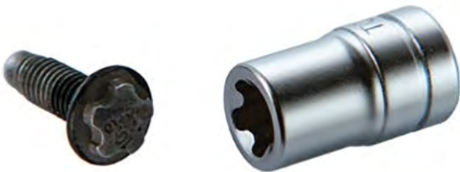
Llave pentalobular de Tesla