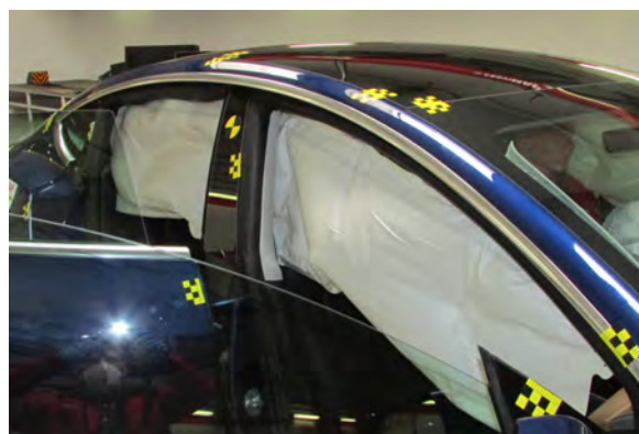
Airbag de cortina del lado derecho

Analizamos, en primer lugar, el despliegue de los airbags, algo totalmente innecesario, pues-