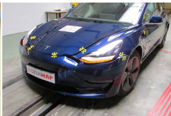
Después del crash test CESVIMAP