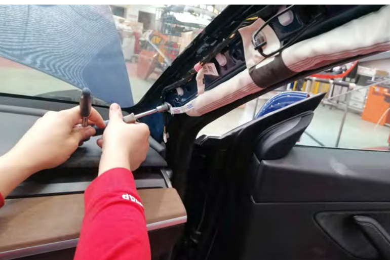
Técnico de taller sustituyendo el airbag de cortina del Model 3

Tras diferentes problemas encontrados con el suministro de las piezas a través del canal oficial de posventa de Tesla, por fin, hemos conseguido: