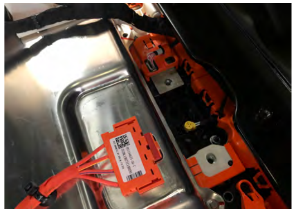
Ubicación del disyuntor pirotécnico de alta tensión en la batería de tracción