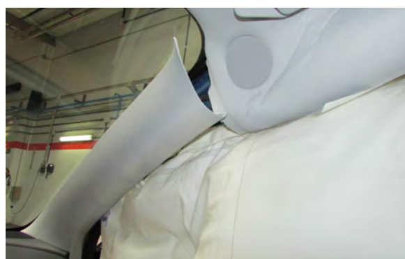
Rotura de molduras del lado derecho

to que solo son útiles cuando existen energías en un accidente que provocan que nuestro cuerpo colisione contra partes rígidas del vehículo. No es el caso. A esa velocidad no existe energía suficiente para que un airbag nos tenga que proteger. Además, su propio despliegue puede ser negativo, por su gran velocidad de inflado y posibilidad de que nos golpee. Hace años este era un hándicap de muchos fabricantes, pero prácticamente todos han