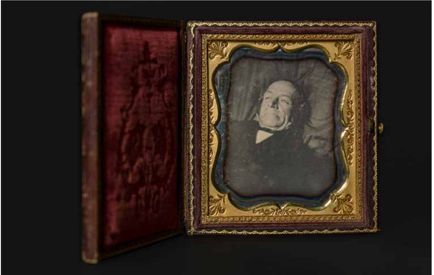
Autoría desconocida Retrato post mortem, ca. 1853 Daguerrotipo, 1/6 de placa CRDI. Colección Ángel Fuentes de Cía

que en 1851 se habían producido millones de retratos al daguerrotipo —la mayor parte de ellos carecen de inscripciones en marcos o estuches que permitan identificar al retratado o al retratista—, que en su momento fueron muy apreciados, aunque despertaban en el espectador la sensación de estar viendo algo que en realidad no existía.