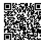
Diccionario de seguros

La última versión es de acceso totalmente abierto y gratuito y esperamos contar de manera especial con las necesarias aportaciones de la comunidad aseguradora y, en particular, de la rica terminología iberoamericana