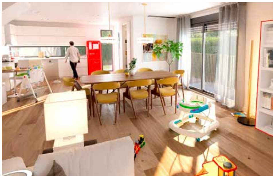
El proyecto La Ciudad Virtual recrea el interior y el exterior de una vivienda y nos reta a descubrir todos los peligros que nos acechan en el hogar.

Según datos de la Organización Mundial de la Salud (OMS), el 90 % de las lesiones infantiles se deben a siniestros involuntarios, cuyas trágicas consecuencias son el fallecimiento de 830.000 niños cada año en todo el mundo