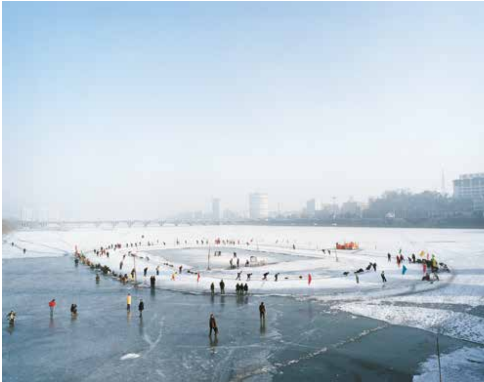
De la serie Escenario Pista de hielo. Vista de una ciudad minera que formaba parte de la zona ferroviaria del sur de Manchuria durante la ocupación japonesa, Fushun, China, 2007 Copia cromogénica