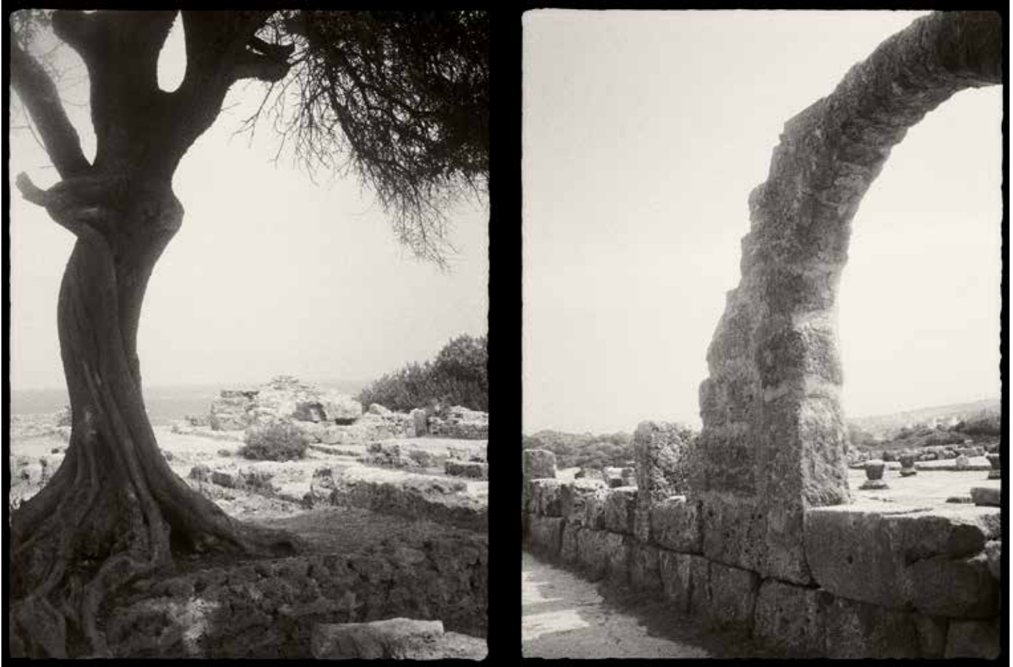
De la serie Correspondencia. Carta a un amigo Un vistazo al mar, Tipasa, Argelia, 2017 Copia al platino-paladio

B-52, aquellos que durante la guerra de Irak salían de la base de la Real Fuerza Aérea de Fairford, en Cotswold, Inglaterra, para atacar Bagdad. Estos, a su vez, recuerdan a la artista las historias sobre los ataques aéreos durante la Segunda Guerra Mundial que le contaban sus padres cuando era pequeña. Cada uno de los lugares que fotografía se convierte en espacios marcados por la guerra y la tragedia.