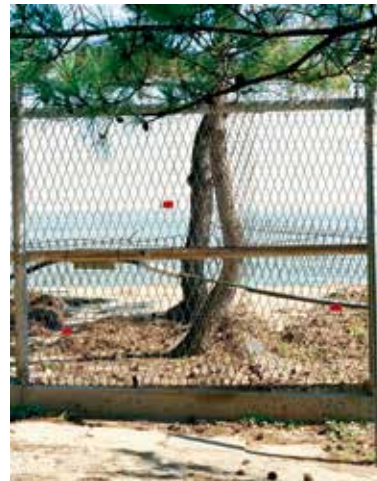
Tomoko Yoneda De la serie ZDC Entwined pines beyond the border fence (the northeastern front line, Goseong, South Korea) [Pinos entrelazados al otro lado de la valla fronteriza (línea del frente nororiental, Goseong, Corea del Sur)]

Sala Recoletos (Madrid) Del 09/02/2021 al 09/05/2021