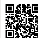
Centro de Documentación

Se dispone también de una sala de lectura abierta al público en Madrid donde, mediante cita previa, se atiende directamente a particular o profesional interesados en consultar nuestro fondo, aunque este año no es posible su acceso a causa de la COVID-19.