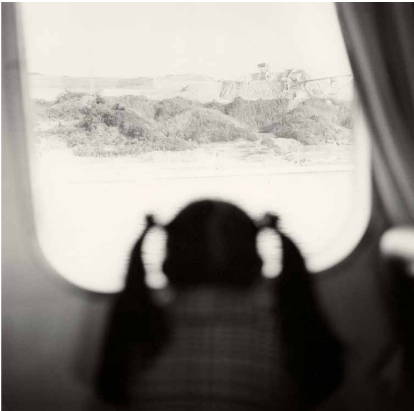
De la serie Una década después Observando el epicentro, isla de Awaji, 1995 Copia de plata en gelatina

separadas, sino como una investigación lineal en la que se plantean las mismas cuestiones relacionadas con el pasado y en la mayor parte de las ocasiones,