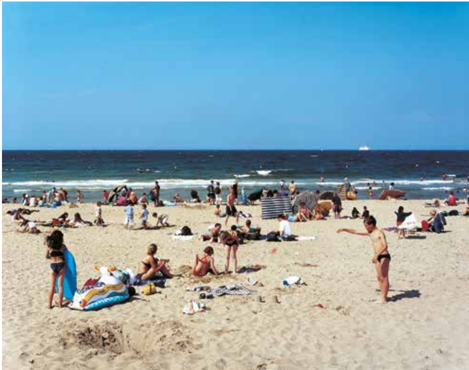
De la serie Escenario Playa. Lugar donde se produjo el desembarco de Normandía, Playa de Sword, Francia, 2002 Copia cromogénica

llamaba el sistema imperial, al que se oponía. El imperialismo continúa siendo hoy en día un tema controvertido para los japoneses. En el seno del país, en las casas e incluso en los colegios, resulta complicado hablar, a pesar del paso de los años, de las atrocidades cometidas por el ejército imperial en sus colonias del este asiático, quizá con la esperanza de que lo que no se habla es como si no hubiera tenido lugar.