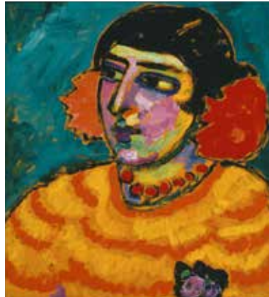
Alexei von Jawlensky Spanische Frau [Mujer española], 1910 Colección particular

Sala Recoletos (Madrid) Del 09/02/2021 al 09/05/2021