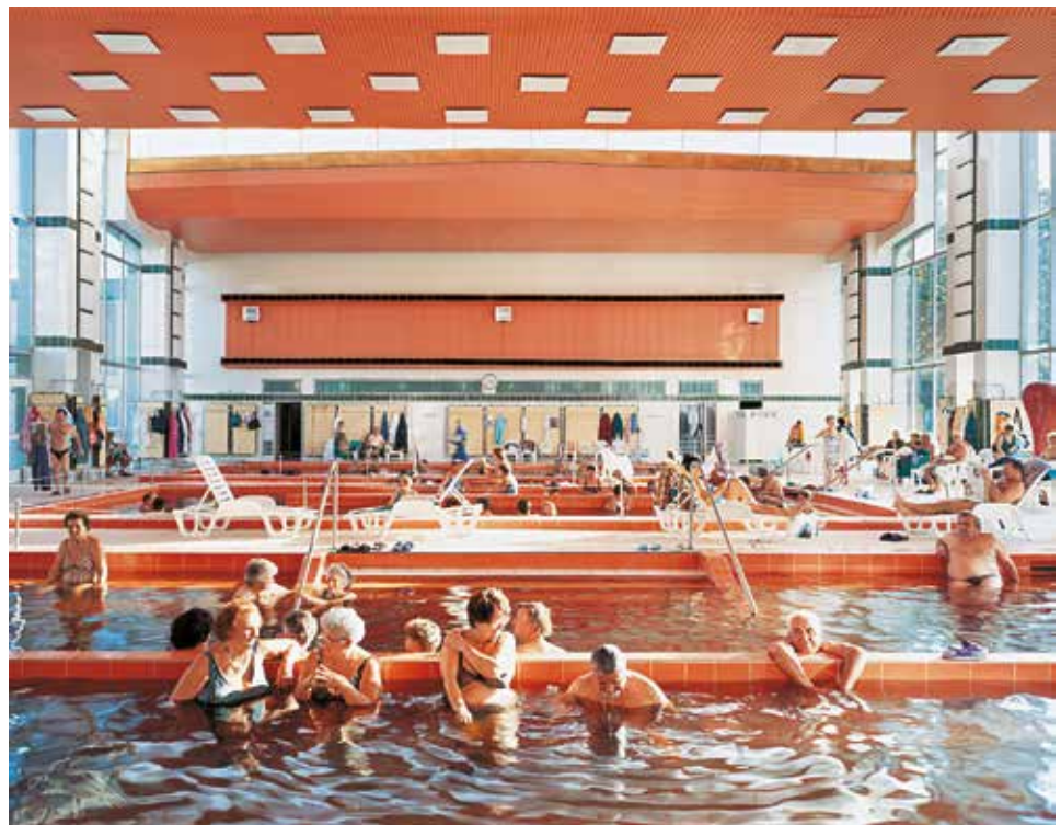
De la serie Después del deshielo Baño de barro, Hajdúszoboszló, Hungría, 2004 Copia cromogénica