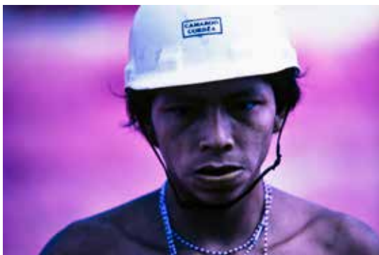
Claudia Andujar Yanomami trabajando en las obras de la carretera Perimetral Norte. Roraima, 1975

Centro de Fotografía KBr Fundación MAPFRE Del 26/02/2021 al 23/05/2021