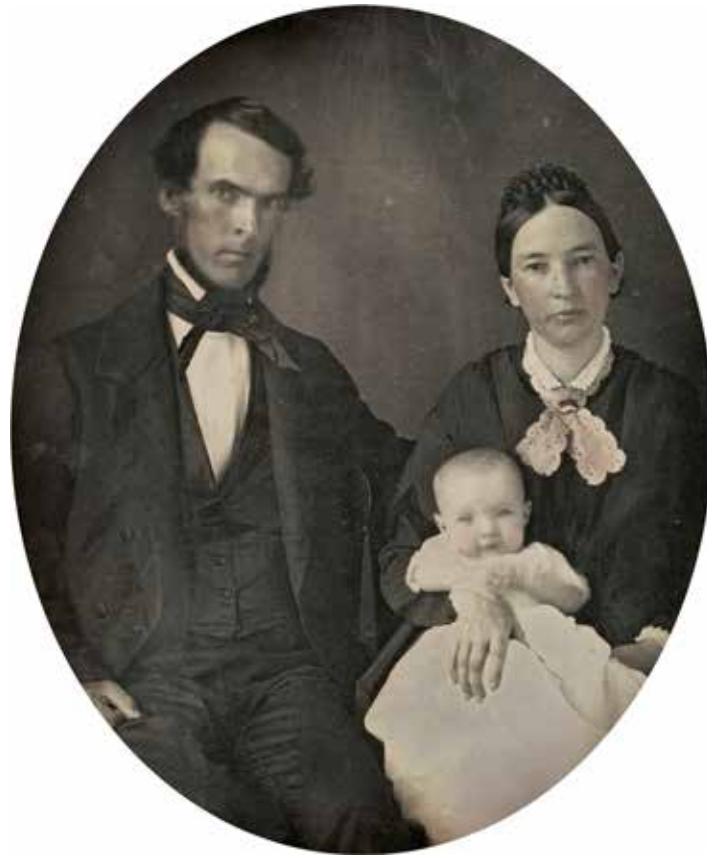
Autoría desconocida Retrato de familia, ca. 1850-1854 Daguerrotipo, 1/6 de placa

o de grupo y post mortem , mientras las dos imágenes en formato estereoscópico reproducen esculturas. Se ha identificado la autoría de algunas de estas piezas gracias a las inscripciones contenidas en los marcos, pero por lo general no se conoce el nombre de los retratados, excepto cuando las imágenes llevan alguna anotación adjunta. La muestra se completa con objetos y utillaje vinculados a esta técnica fotográfica procedentes de la colección del Museu del Cinema de Girona como una caja en la que