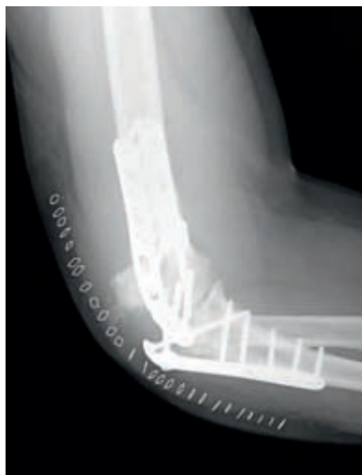
Fig. 4. Fractura de cúbito proximal sobre placa de olécranon, que requirió una reosteosíntesis con una placa más larga.

En cuanto a las complicaciones registradas, con doble placa tuvimos un 77,3% de complicaciones, siete síndromes capsulares de hombro, dos fracturas de cúbito, cinco síndromes febriles postintervención, 63,6% de rigideces, 4,5% de pseudoartrosis de olécranon, una refractura de la osteotomía (Figura 4), 3 casos de lesión cubital. 5 casos (71,4%), requirieron artroscopia posterior. No tuvimos ninguna pseudoartrosis y aparecieron dos casos de infección. En el grupo con una sola placa una fractura seccionó el cubital y observamos hasta un 81,3% de complicaciones, 22,2% síndrome capsular del hombro, 66,7% protusión de material, epidermolisis en la zona de la herida en el 11,1%, 87,5% de rigideces, 5 casos de lesión cubital. Se requirió la liberación del codo en el 16,7%, especialmente si existía el antecedente de fractura abierta. Tuvimos dos infecciones. (S.Coagulasa negativo, S. Epidermidis), un caso de rotura de la placa, 3 casos de parecias radiales, un 12,5% de calcificaciones heterotópicas