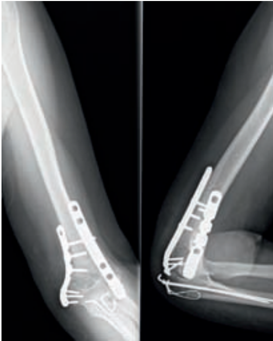
Fig. 1. Fractura supracondílea tipo C2, tratada quirúrgicamente mediante osteosíntesis con doble placa, perpendicular, según técnica AO.