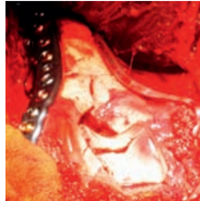
Fig. 3. Abordaje de la fractura tras osteotomía de olécranon. Disección y aislamiento del nervio cubital. Reducción y osteosíntesis con placas Acumed® (Clínica Mayo).

afectación de una columna, el 31,3% fueron intraarticulares con afectación de dos columnas y el 12,4% extraarticulares intracapsulares transcolumnares altas. Se requirió os-