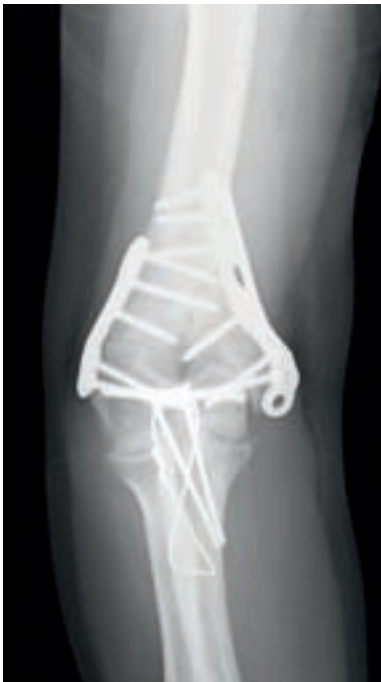
Fig. 2. Fractura supracondílea tipo C3, tratada quirúrgicamente mediante osteosíntesis con doble placa en paralelo, según principios de la Clínica Mayo.

afectación de una columna, el 31,3% fueron intraarticulares con afectación de dos columnas y el 12,4% extraarticulares intracapsulares transcolumnares altas. Se requirió os-