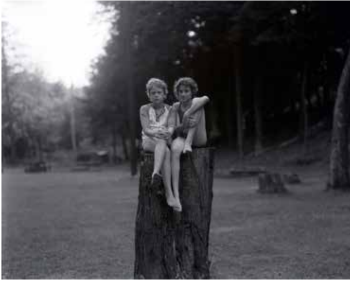
Judith Joy Ross Sin título, Eurana Park, Weatherly, Pensilvania, 1982 © JUDITH JOY ROSS, COURTESY GALERIE THOMAS ZANDER, COLOGNE