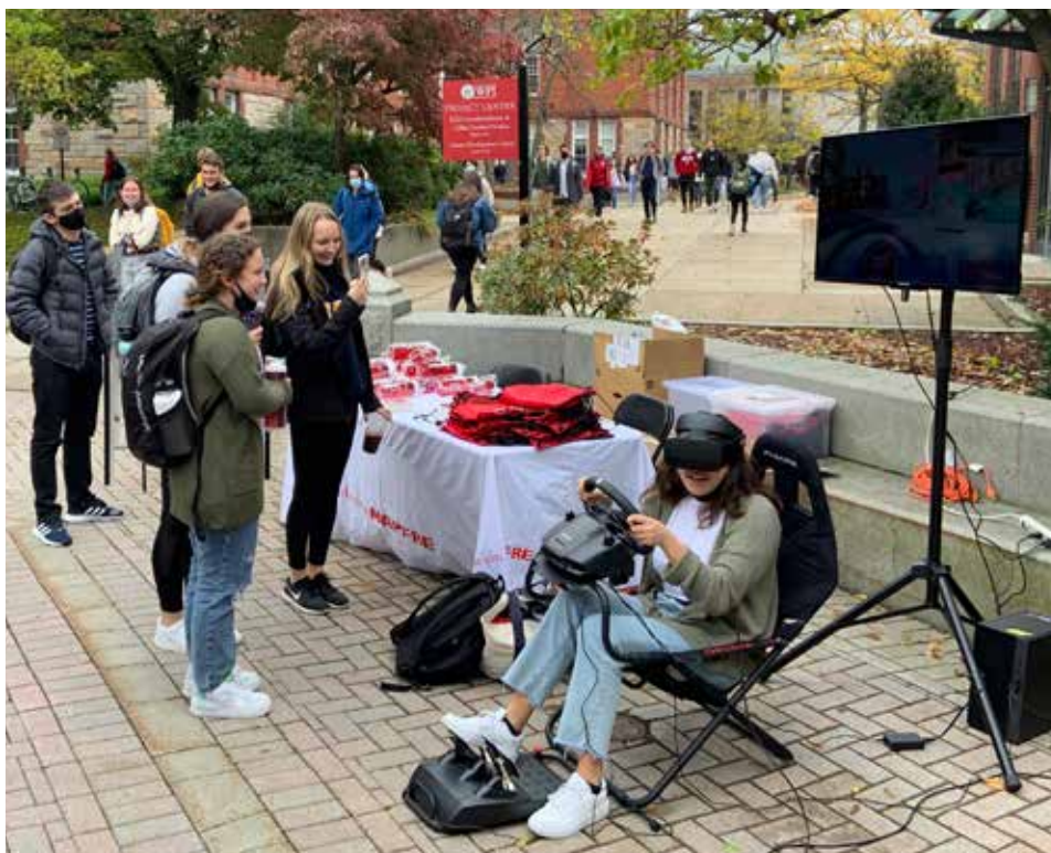
Estudiantes probando las gafas de realidad virtual

Esta escena en clave de humor sobre una cuestión tan delicada transmite el mensaje más importante de la campaña: cuidémonos los unos a los otros. ❌