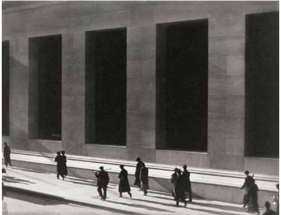
Paul Strand Wall Street, New York [Wall Street, Nueva York], 1915 Colecciones Fundación MAPFRE

Museo Carmen Thyssen Del 16/11/2021 al 06/03/2022