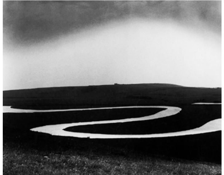
Bill Brandt Río Cuckmere, 1963 Colección privada.