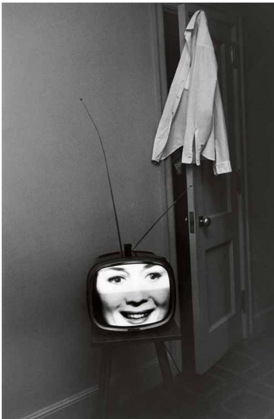
Nashville, 1963 Imagen de plata en gelatina

Rochester. Y, al año siguiente, en la modesta pero emblemática muestra New Documents , organizada por John Szarkowski, también en el MoMA de Nueva York. En ella, Lee Friedlander estaba acompañado por Garry Winogrand y Diane Arbus. Tras esta exposición, las obras de los tres serán consideradas como parte de las grandes renovaciones de la fotografía del siglo xx.