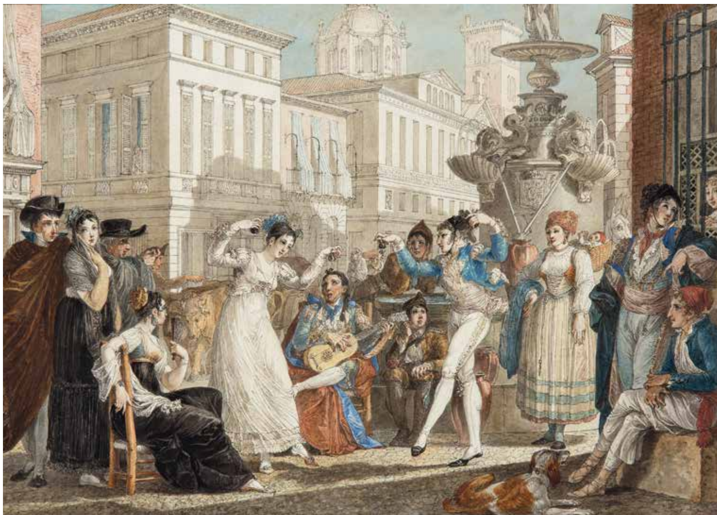
Jean-Démosthène Dugoure Escena costumbrista , 1813 Lápiz y acuarela sobre papel, 19 x 27 cm Instituto Ceán Bermúdez, Madrid

de España: en 1835 recibió la misión de reunir una colección de cuadros españoles con destino al museo del Louvre, campaña financiada personalmente por el rey Luis Felipe, que ansiaba hacerse con una Galérie espagnole aprovechando la inminente desamortización de Mendizábal. Los dos artistas franceses más implicados en la ejecución de los dibujos ilustrativos de la obra del barón fueron Adrien Dauzats y Pharamond Blanchard que además contribuyeron a localizar