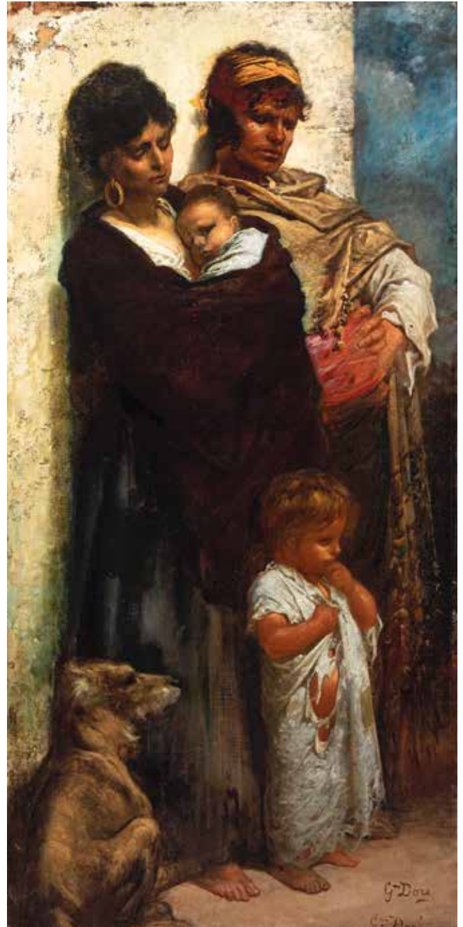
Gustave Doré Los vagabundos, ca. 1868-1869 Óleo sobre lienzo, 197 x 95 cm Museo de Bellas Artes de Bilbao

los cuadros destinados a la galería española de Luis Felipe.