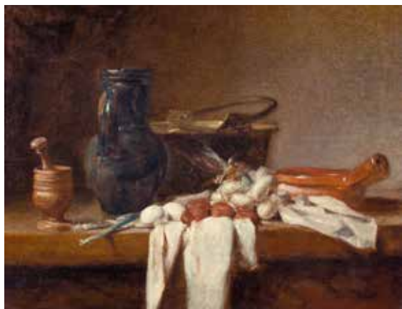
Jean-Baptiste-Siméon Chardin Bodegón con almirez, cántaro y caldero de cobre, ca. 1728-1732 Óleo sobre lienzo, 32,5 x 39 cm Museo Nacional Thyssen-Bornemisza, Madrid