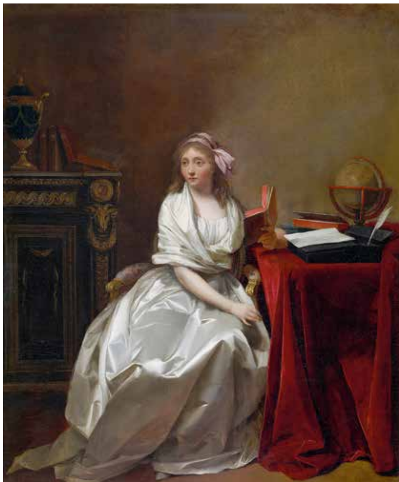
Louis-Léopold Boilly La lectura , ca. 1789-1793 Óleo sobre tabla, 32 x 27 cm Colección particular

A finales del siglo XVIII Francia y España se aliaron oficialmente y comenzó a producirse un cambio con respecto a la visión que desde el extranjero se tenía de esta última