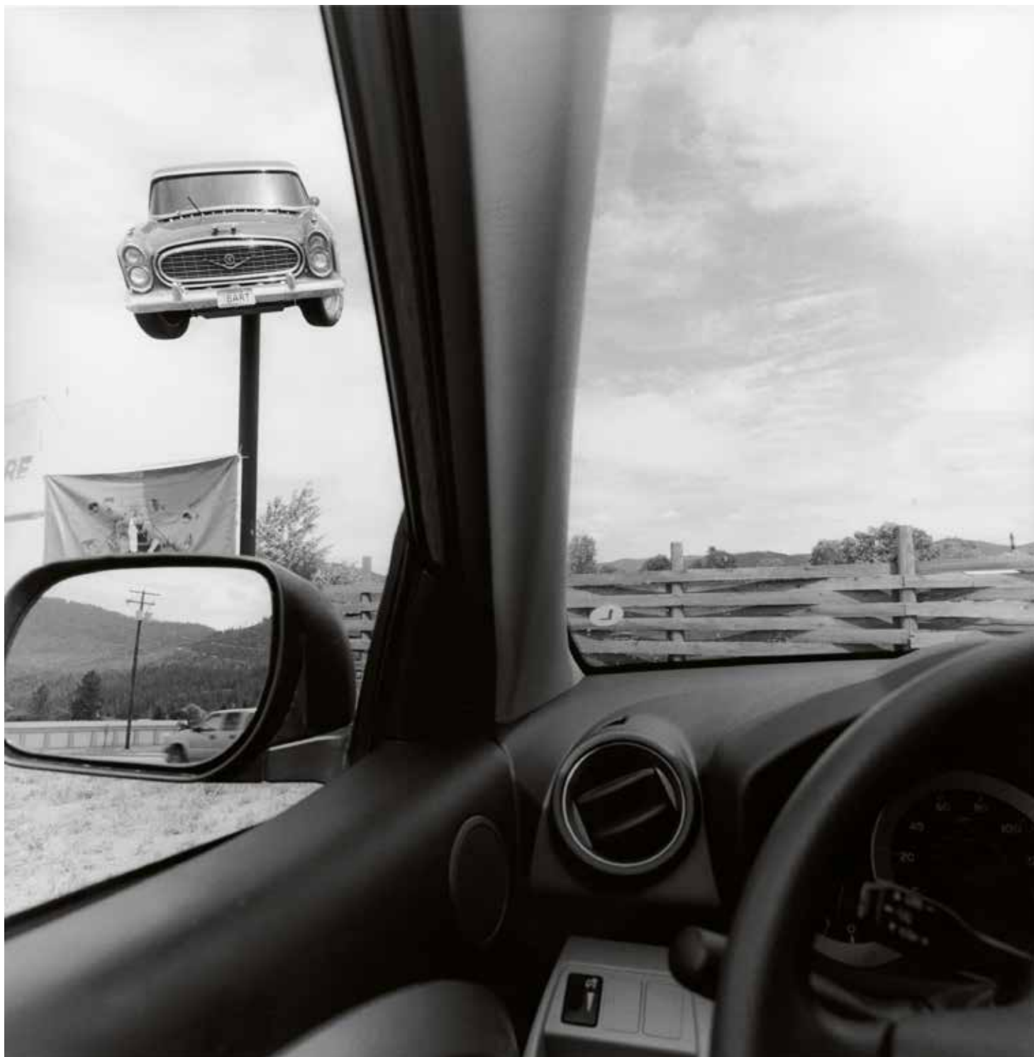
Montana, 2008 Imagen de plata en gelatina

A lo largo de toda su trayectoria, Lee Friedlander ha ido retomando los temas de sus fotografías una y otra vez, en un continuo work in progress que se va enriqueciendo con el aprendizaje del medio y la experiencia