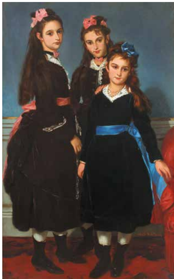
Alfred Dehodencq Las hijas del duque de Montpensier , ca. 1861 Óleo sobre lienzo, 160 x 101 cm Museo Nacional del Romanticismo