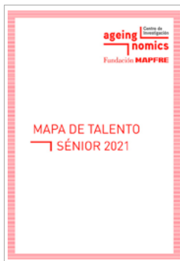
Portada del informe Mapa de Talento Sénior 2021 , elaborado por el Centro de Investigación Ageingnomics de Fundación MAPFRE

Así lo demuestra el Mapa del Talento Sénior 2021, un informe