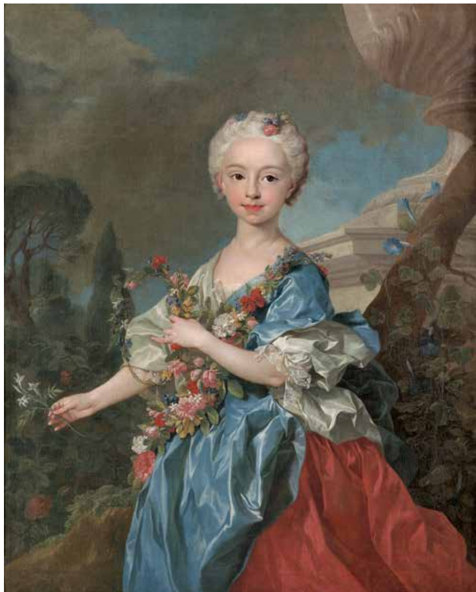
Louis-Michel Van Loo María Antonia Fernanda de Borbón, infanta de España, ca. 1737 Óleo sobre lienzo, 88,3 x 71,3 cm Museo de Bellas Artes de Asturias. Depósito de la colección del IX conde de Villagonzalo

Louis-Michel Van Loo sustituye a este último y se convierte en el primer pintor del rey, así como en director de pintura de la Real Academia de Bellas Artes de San Fernando, fundada en 1752. De su mano es el retrato María Antonia Fernanda de Borbón, infanta de España , ca. 1737.