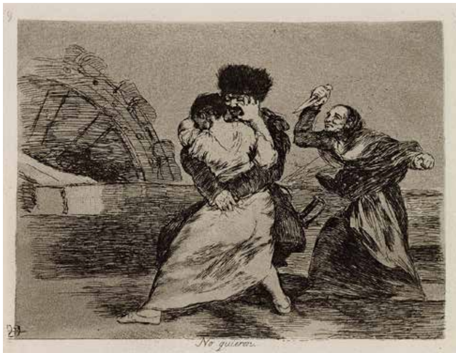
Francisco de Goya y Lucientes No quieren, ca. 1810-1814 Desastres de la Guerra de Francisco de Goya y Lucientes

Museo de Bellas Artes Del 20/01/2022 al 03/04/2022