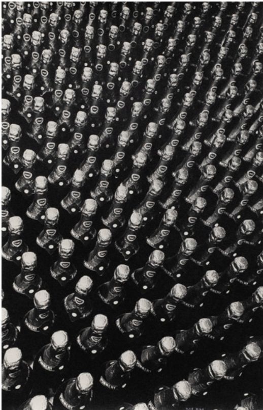
Ilse Bing Fulla morta i bitllet de tramvia a la vorera, Frankfurt, 1929 Ampolles de xampany Pommery, 1933