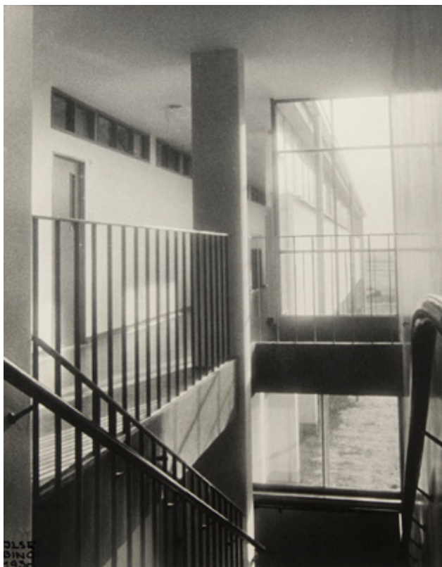
Ilse Bing BudgeHeim, 1930