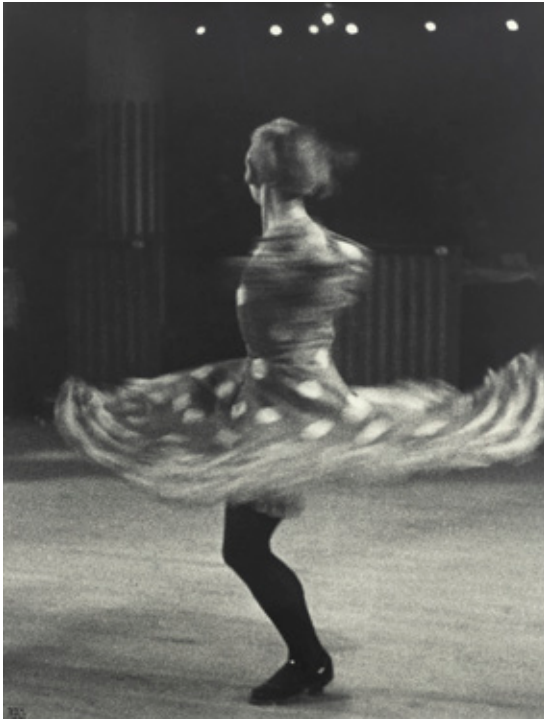
Ilse Bing Ballarina de cancan, 1931

Ilse Bing va ser una artista multidisciplinària i, quan va fer seixanta anys, va decidir deixar de banda la fotografia i dedicar-se a d'altres passions que també tenia: a fer collages , obres abstractes o dibuixos, i també a escriure poemes.