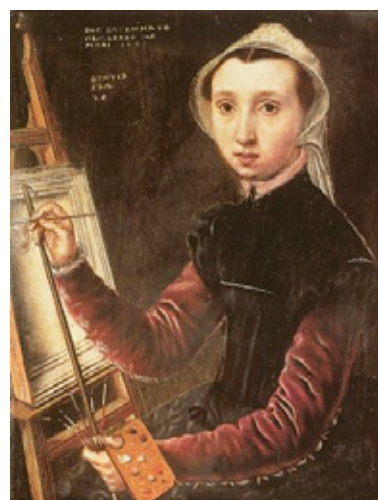
Caterina van Hemessen Autoretrat, 1548 Museu d'Art de Basilea

La PINTURA FLAMENCA es va desenvolupar durant els segles XV-XVII en una regió que coincideix aproximadament amb l'actual Bèlgica. Es caracteritza per la importància que dona als colors i als detalls.