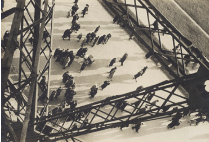
Ilse Bing El Camp de Mart des de la Torre Eiffel, 1931

A Ilse Bing l'apassionava l'arquitectura, la forma dels edificis i les ombres que aquests edificis projectaven sobre els carrers de les ciutats. Durant el temps que va viure a París, va fotografiar la Torre Eiffel, una de les obres més famoses de la capital francesa. A Ilse li interessava tant la bellesa com la geometria de la construcció. També l'atreia l'ambient al voltant del monument, que va fotografiar des de dalt la torre.