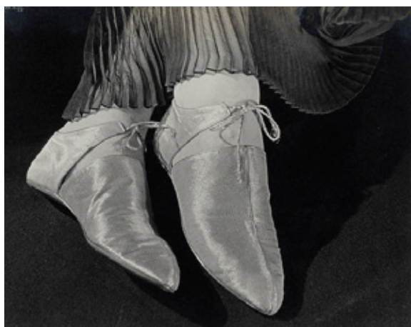
Ilse Bing Sabates de nit de lamé daurat, 1935

Ilse Bing pot ser considerada la primera dona fotògrafa que va dedicar part del seu treball a reflectir la moda parisenca. El 1933 va començar a col·laborar amb la revista Harper's Bazaar , en la qual mostrava complements de tota mena: barrets, guants, sabates, etc. La forma especial de fotografiar-los, seguint el model surrealista de representar objectes senzills, feia que aquestes peces semblessin sofisticades i luxoses, la qual cosa feia al seu torn que les lectores s'hi interessessin ràpidament.