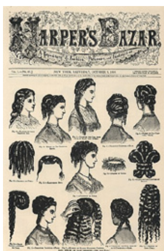
Portada de la revista Harper's Bazaar , octubre del 1868