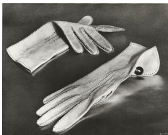
Ilse Bing L'honorable Daisy Fellowes, guants de Dent de Londres per a Harper's Bazaar , 1933