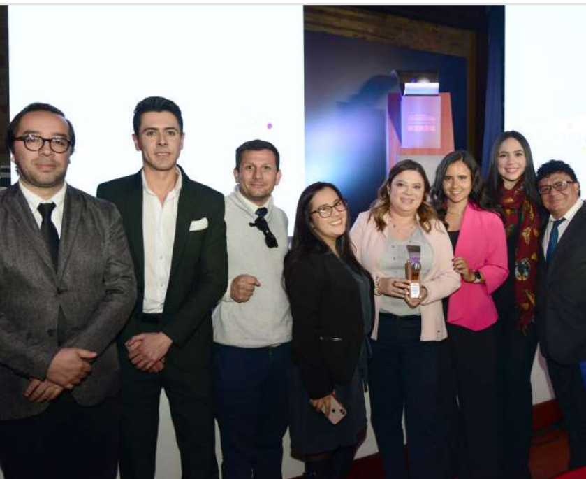
↑ Equipo de Bien Dateado - Canal Institucional

El jurado valoró que la periodista presenta con habilidad informativa la situación tan delicada del servicio de las ambulancias y narra con destreza casos específicos de mal manejo en los procesos y fraudes. Se trata de un informe completo y bien documentado, con un impecable hilo narrativo.