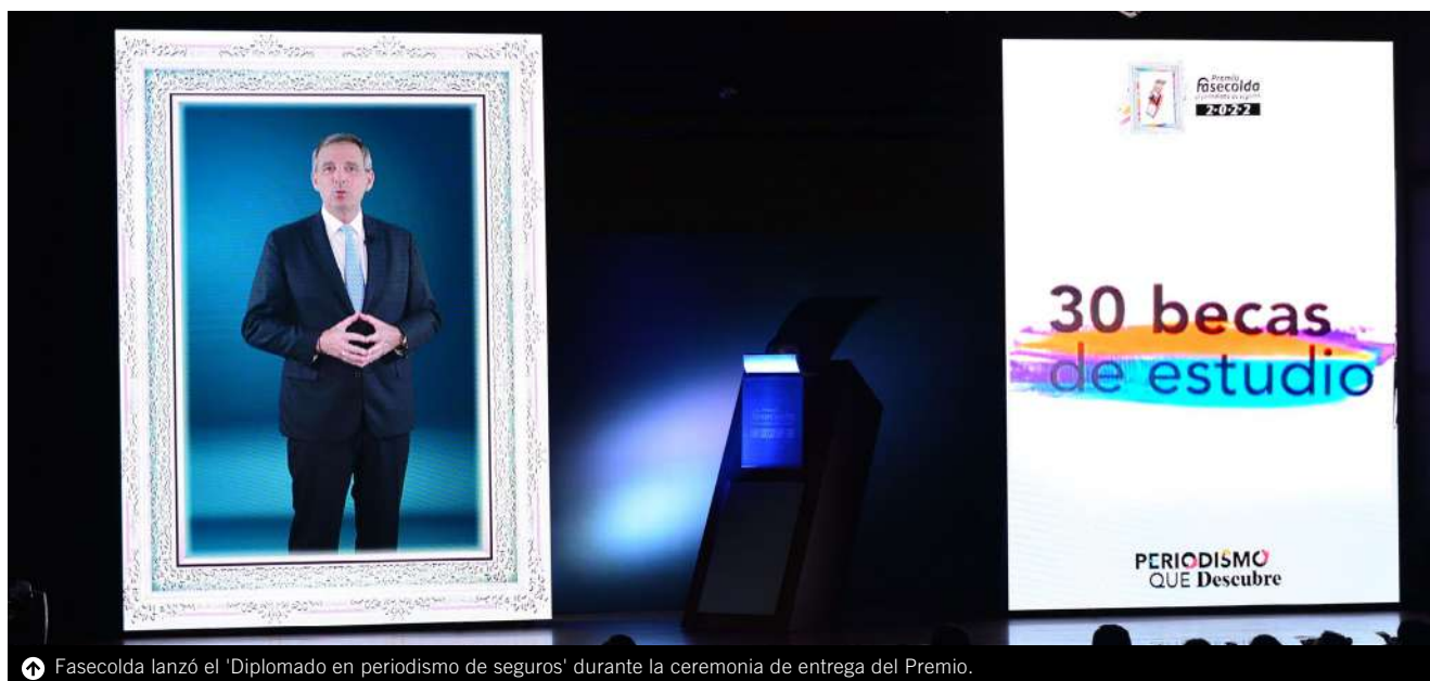
↑ Fasescolda lanzó el 'Diplomado en periodismo de seguros' durante la ceremonia de entrega del Premio.