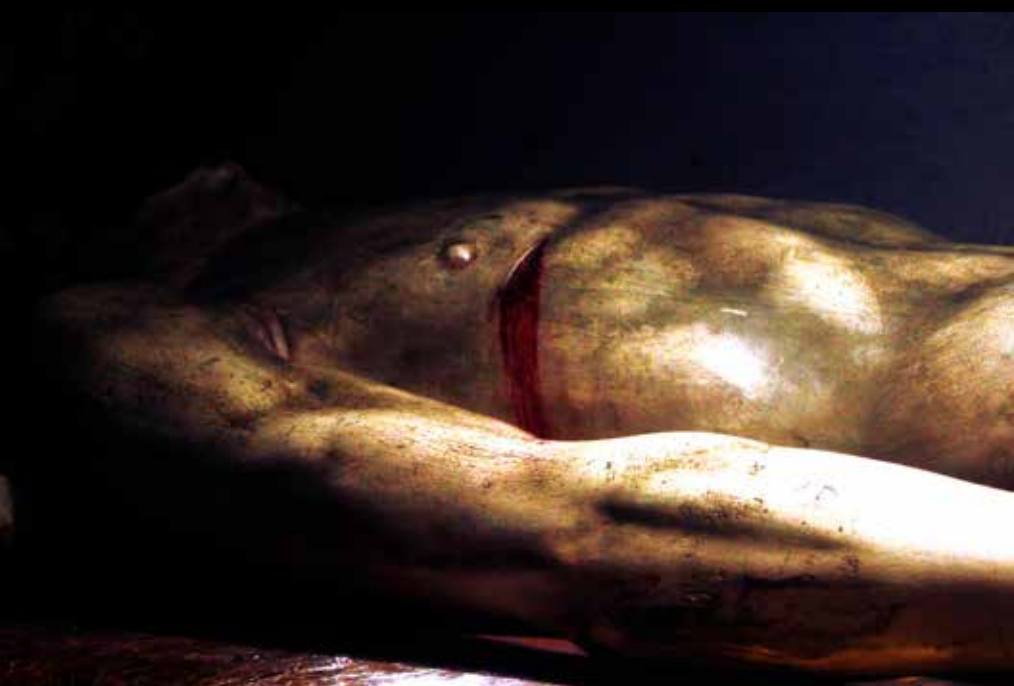
BERNAT ERRA, Fe de erratas , 2023 Fotografía analógica.