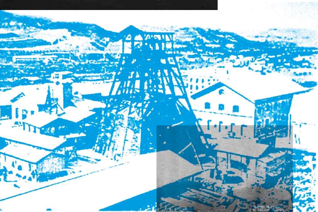
SURIA. — Installations de