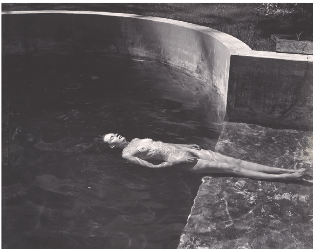
Desnudo flotando , 1939.