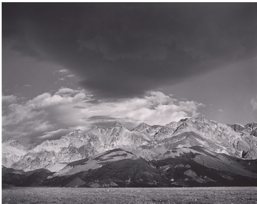
Nubes, Death Valley, 1939.