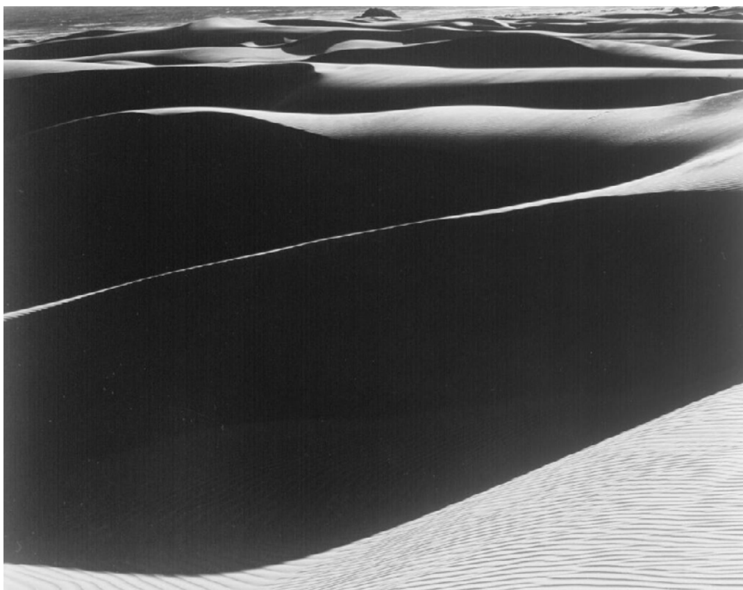
Dunas, Oceano, 1936

The Huntington Library, Art Museum, and Botanical Gardens