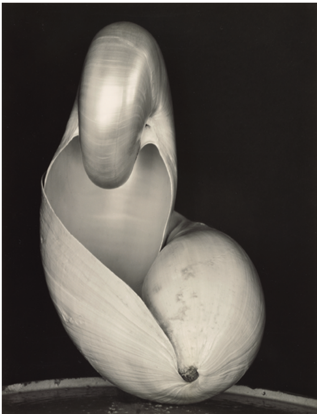
Dos conchas , 1927. Copia c.1933

El dominio técnico del medio fotográfico lleva a Weston a un formalismo donde el encuadre se convierte en uno de los elementos más relevantes de su trabajo. En este sentido, elimina cualquier aspecto anecdótico y se centra en el motivo que le interesa, y lo hace con tal realismo y con tal exaltación del carácter bidimensional de la fotografía que este termina por resultar en una imagen abstracta. De este modo el artista muestra que la figuración y la abstracción no se excluyen la una a la otra, sino que son perfectamente compatibles.