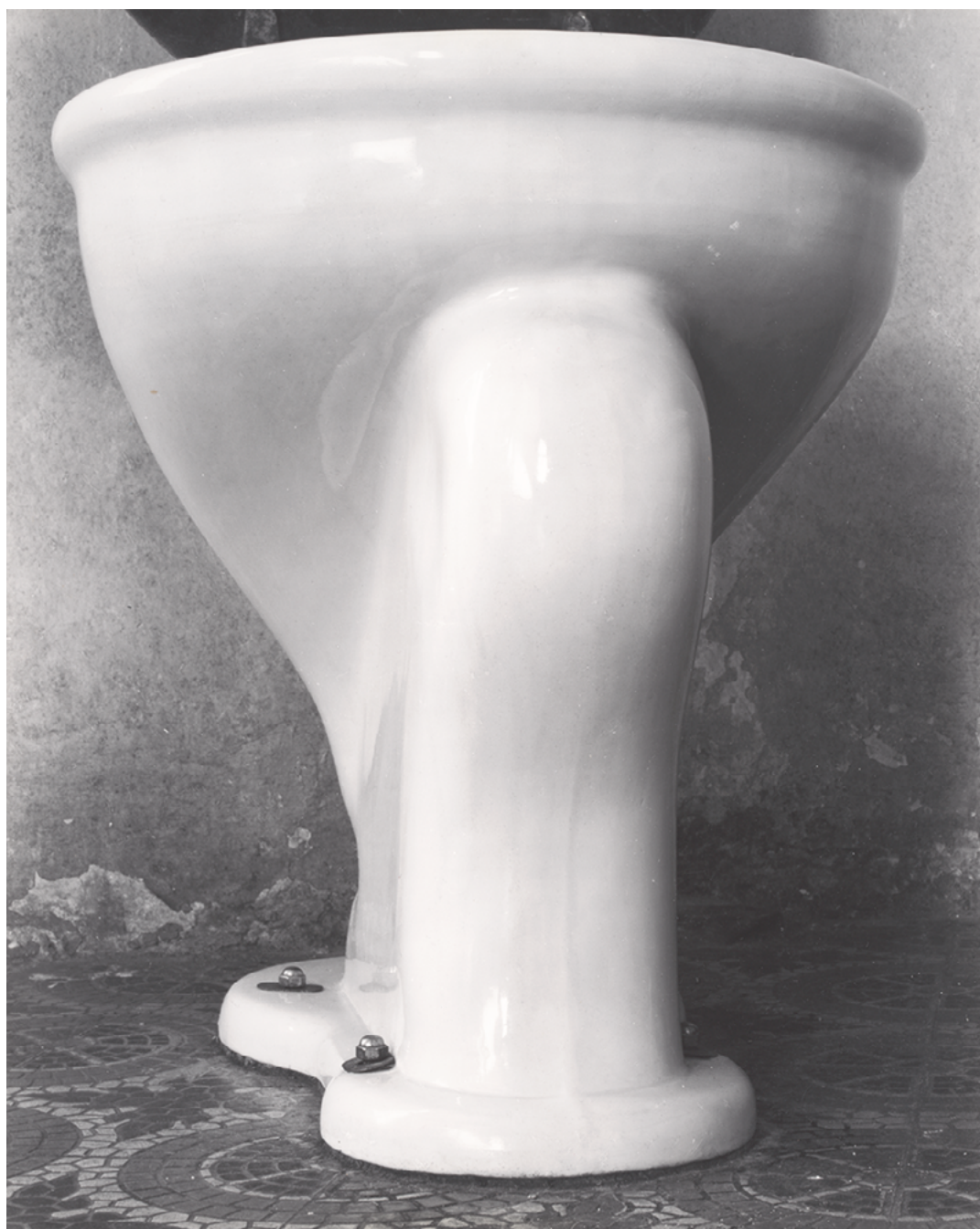
Excusado, México. Octubre de 1925.

Edward Weston fue uno de los pioneros, junto con Alfred Stieglitz o Paul Strand, en la defensa de la emancipación de la fotografía de otras disciplinas artísticas. En este sentido, su trabajo resulta imprescindible para comprender, en sus inicios, la capacidad estética y perceptiva del medio. Esta capacidad permite que la fotografía exprese cualidades estéticas como belleza, dolor, fealdad, etc., al mismo nivel que lo hacen la pintura o la escultura.