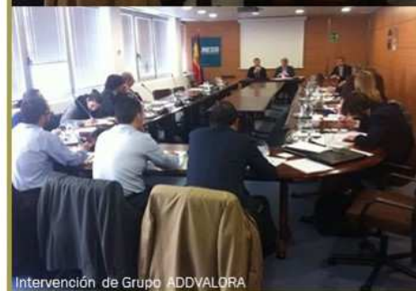
Intervención de Grupo ADDVALORA