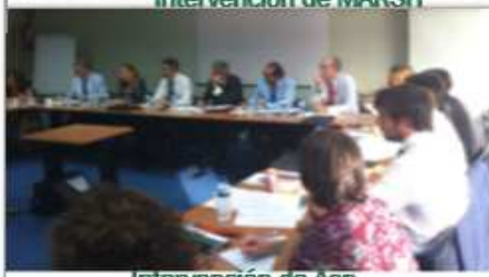
Intervención de Aon