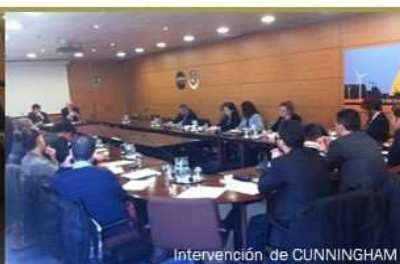
Intervención de CUNNINGHAM