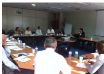
Intervención de MARSH