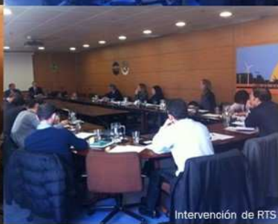
Intervención de RTS