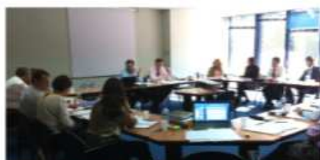
Intervención de March JLT

II Sesión del Manual Catástrofes Naturales Reunión con Brokers