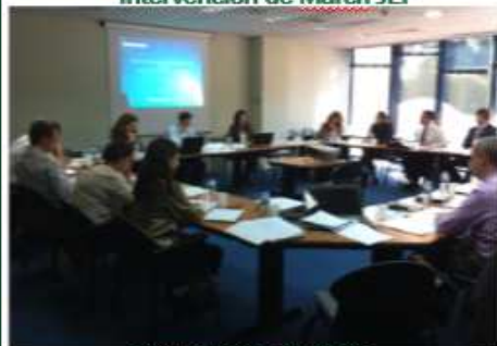
Intervención de Willis