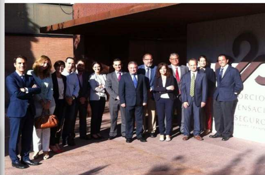
Grupo de Trabajo de Gerentes de Riesgos