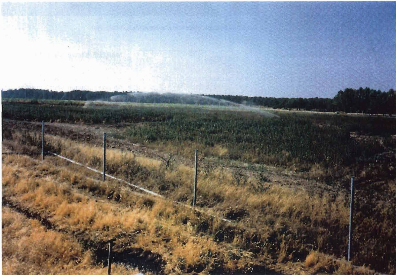
Parque de infiltración de purines en Sebulcor (Segovia).