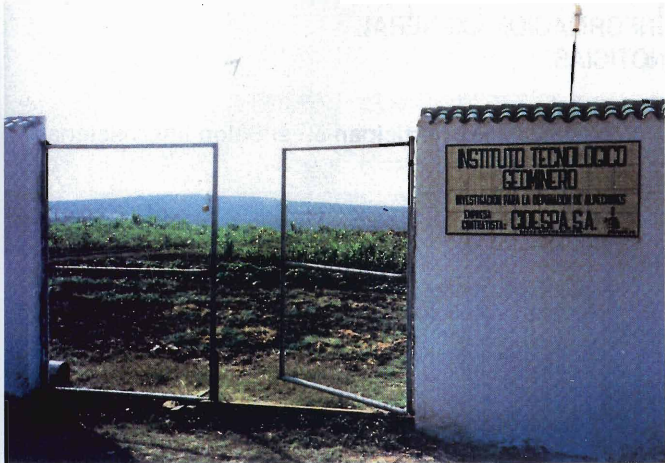
Parques del Instituto Tecnológico Geominero en Baeza (Jaén).

Continuando con los efluentes del ámbito agropecuario, es de gran importancia el parque para la eliminación de purines de ganado de cerda, construido para la granja Las Celdas, en Sebulcor (Segovia). Permite la eliminación simultánea de las fases sólida y líquida del purín, gracias a un sistema de mezcla y agitación instalado en la balsa receptora y a unos cañones de boquilla ancha que hacen posible el riego del parque con la mezcla de ambas fases. Es notable la práctica ausencia de olores durante el riego y la perfecta degradación e incorporación al terreno de la materia orgánica del purín.