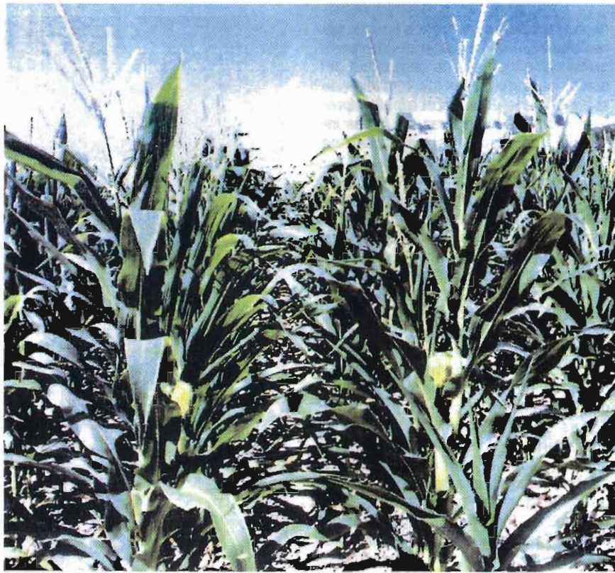
Cultivos de maíz a los cuatro meses de terminada la infiltración. Parque de Baeza.

Un parque muy interesante destinado a la eliminación de alpechines por infiltración somera controlada es el que ha construido la Junta de Castilla y León en Arenas de San Pedro (Ávila). Tiene una superficie de tres hectáreas y se destina a la eliminación del alpechín producido en variasalmazaras de la comarca, entre las que destacan las de Arenas de San Pedro y Pedro Bernardo. Este carácter público del parque de infiltración, destinado a los residuos de distintas instalaciones industriales, es una de las características más interesantes de la aplicación práctica de los procesos INSOCON.