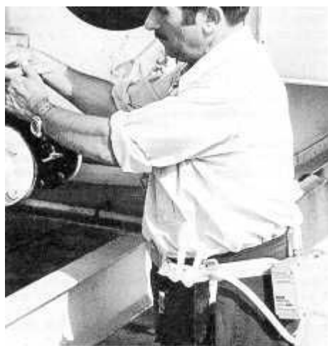
Fig. 3: Toma de muestra con impinger

Colocar la bomba de aspiración convenientemente calibrada, en la parte posterior de la cintura del operario a muestrear, fijándola al cinturón (figura 3).