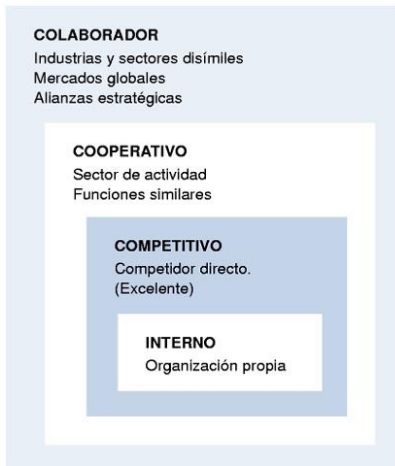
FIGURA 1 Tipos de benchmarking

Esta herramienta sirve, por tanto, para identificar, determinar y lograr estándares de excelencia basados en la realidad del mercado y es un medio para conocer mejor a la competencia. Lo más importante con la práctica de esta actividad es "reflexionar" para encontrar la forma de mejorar teniendo como tema central la "educación mutua".