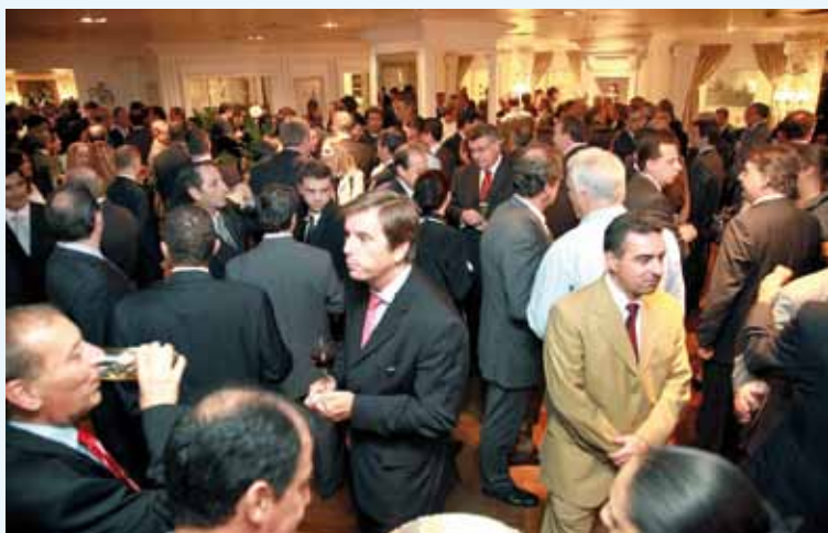
São Paulo Público convidado (executivos de seguradoras e clientes) Guests (clients and insurance companies' executives)