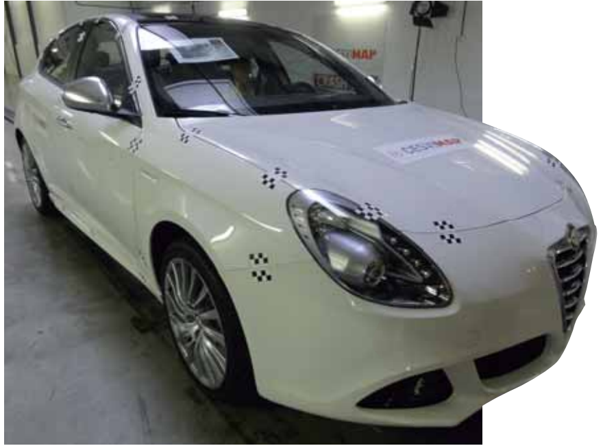
▮ Vehículo preparado para el Crash Test RCAR, en CESVIMAP