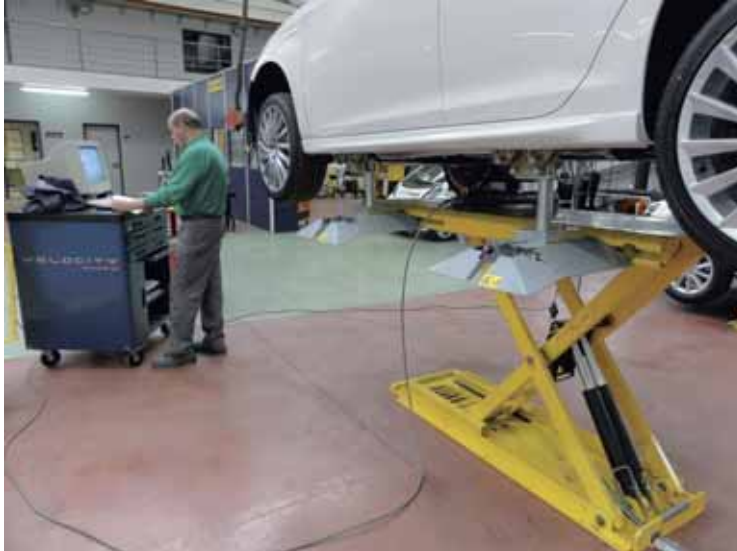
► Comprobación de las cotas del vehículo