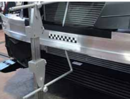
► Traviesas delantera y trasera

que suponen más del 90% de la masa total del sistema. Diversas partes estructurales se han realizado con aceros de alta resistencia, acero templado mediante moldeo en caliente o magnesio. Por otra parte, las traviesas o alma de paragolpes están fabricadas con materiales ligeros, como el aluminio extrusionado, en el caso de la traviesa delantera, y Xenoy en la trasera, un material termoplástico con excelente capacidad de absorción energética en relación al peso. Estos elementos son capaces de absorber los impactos con obstáculos a baja velocidad, como se ha podido constatar en las pruebas de impacto realizadas en CESVIMAP ■