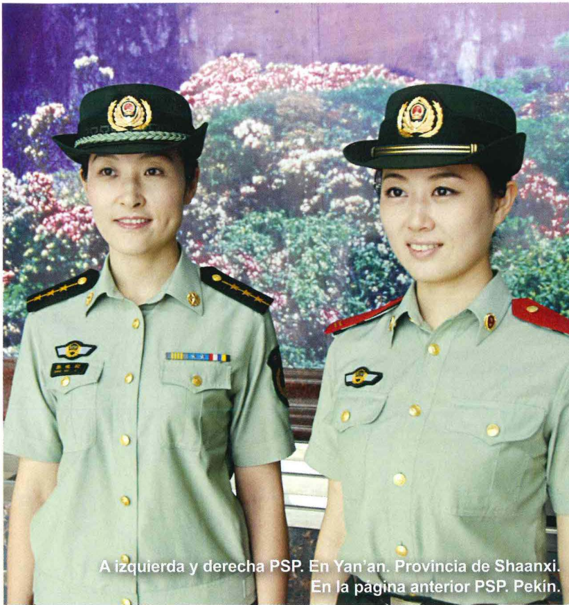
A izquierda y derecha PSP. En Yan'an. Provincia de Shaanxi. En la pagina anterior PSP. Pekin.