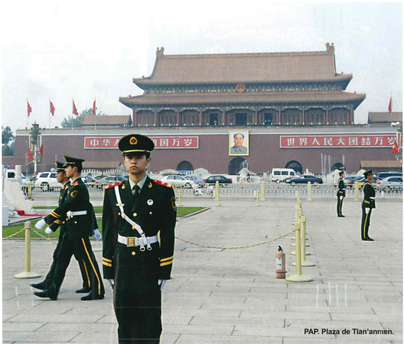
PAP. Plaza de Tian'anmen.

por el MSP. La Policía depende directamente del Ministerio de Seguridad Pública (MSP), que fue creado en 1949.