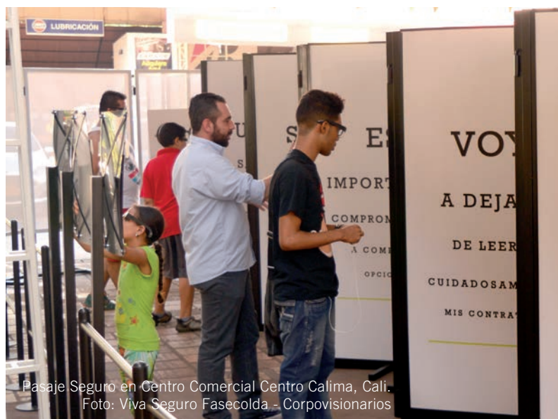
Pasaje Seguro en Centro Comercial Centro Calima, Cali.

➔ El gremio reestructuró el programa Viva Seguro y actualmente desarrolla actividades pedagógicas encaminadas a incentivar la lectura de la póliza y la búsqueda de asesoramiento antes de adquirir seguros, y promover la planeación para el logro de metas.