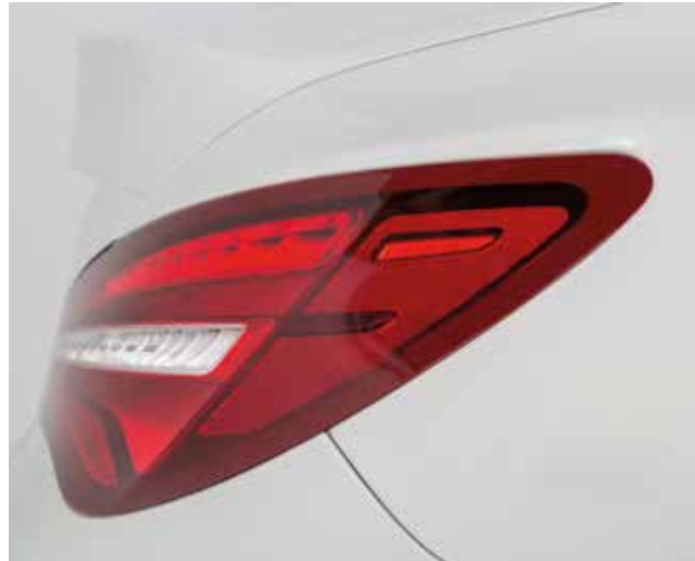
► Detalles del modelo