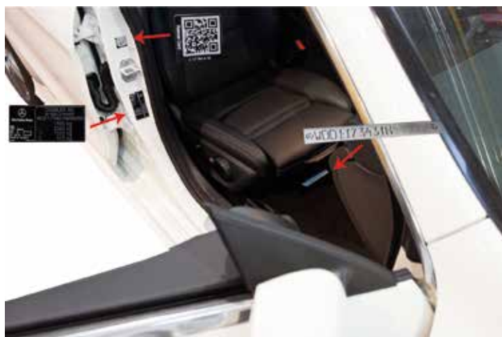
► Identificación del modelo

LOS LARGUEROS DE ACERO DE ALTA RESISTENCIA ABSORBEN MÁS ENERGÍA, REDUCIENDO LA POSIBLE TRANSMISIÓN DE DAÑOS