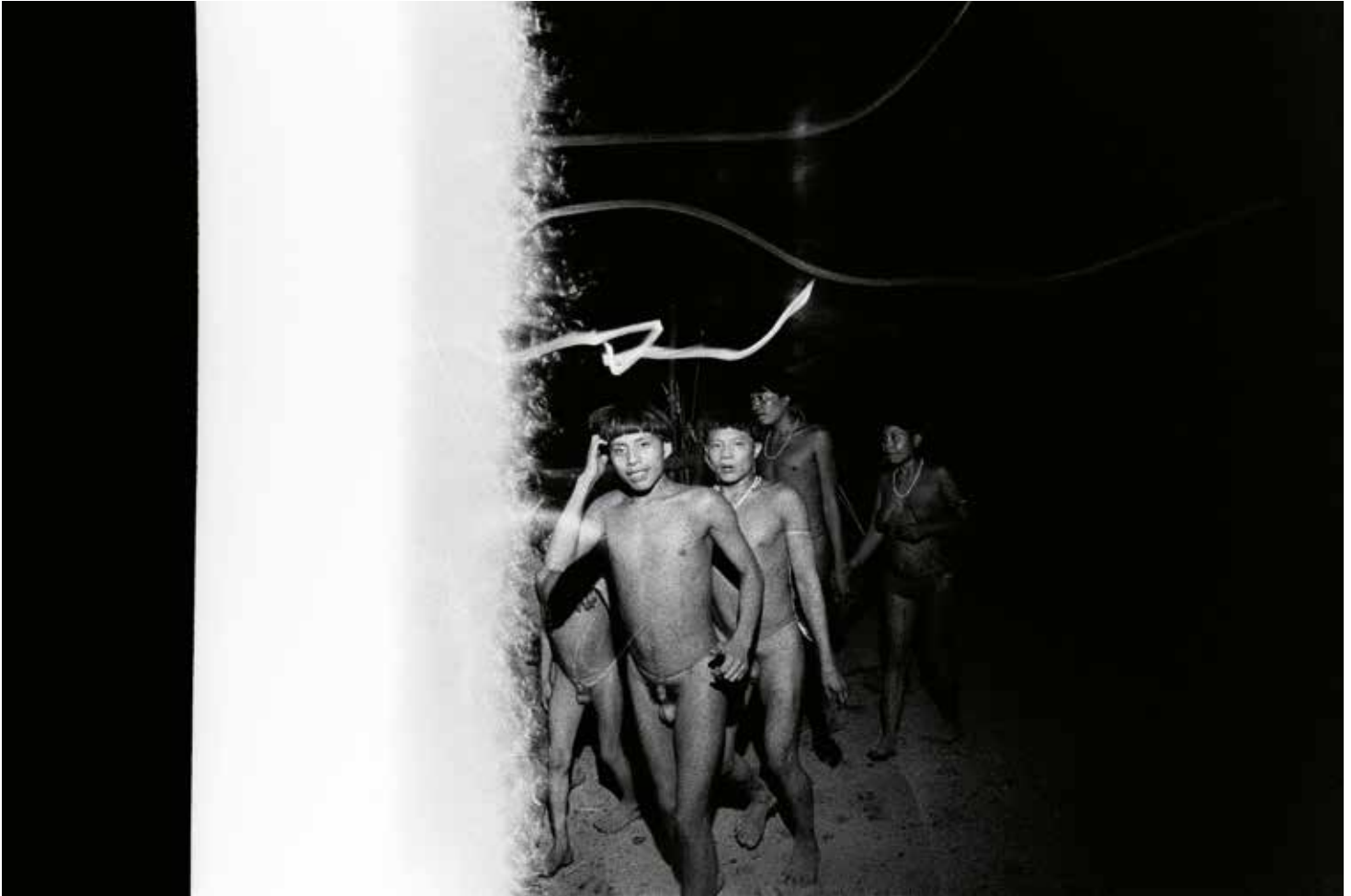
Nakë Ixima y Marokoi Wapokohipi thëri bailan y cantan en la choza comunitaria. Catrimani, Roraima, 1974

entre 1993 y 2013 la artista fue retirándose gradualmente de la escena política recurriendo solo al arte para mantener la visibilidad sobre la causa yanomami. Fue reconocida por la Fundación Lannan, Los Angeles, Estados Unidos con el «Premio a la Libertad Cultural» y participó en el festival de PhotoEspaña en Madrid en 2012. Hoy en día sus obras pueden encontrarse en algunas de las colecciones más importantes del mundo, como el Museum of Modern Art de Nueva York o la George Eastman House, Rochester. En 2004 recibió