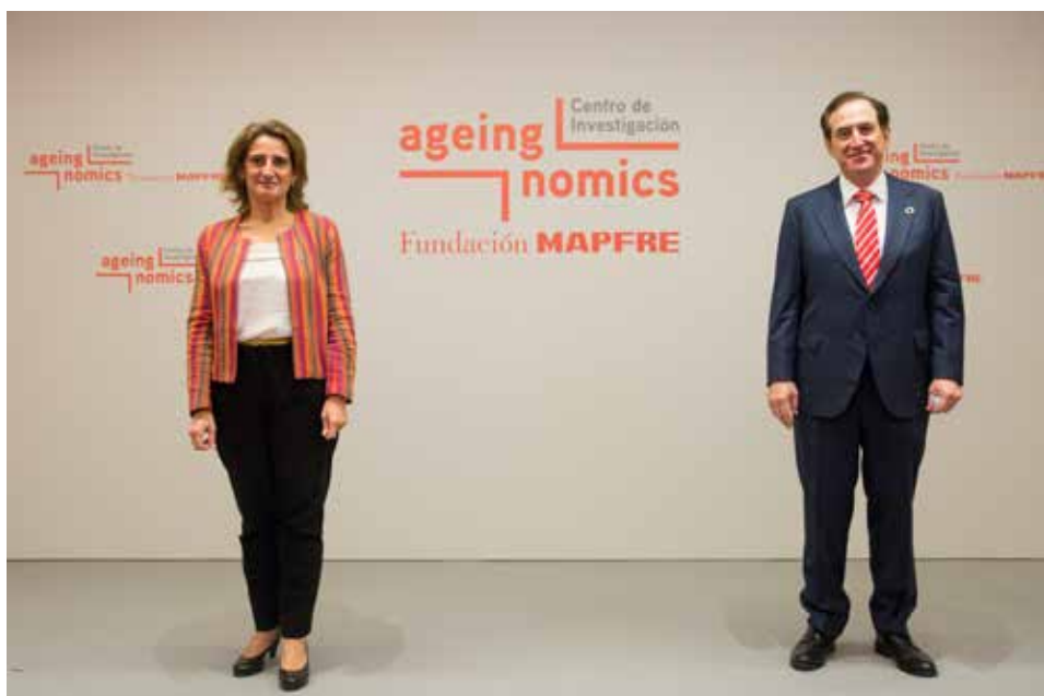
El pasado 10 de diciembre se presentó el nuevo Centro de Investigación Ageingnomics Fundación MAPFRE. El acto contó con la presencia de la vicepresidenta cuarta del Gobierno y ministra para la Transición Ecológica y el Reto Demográfico, Teresa Ribera

Este centro nace con la vocación de contribuir a que España lidere una estrategia mundial para que el