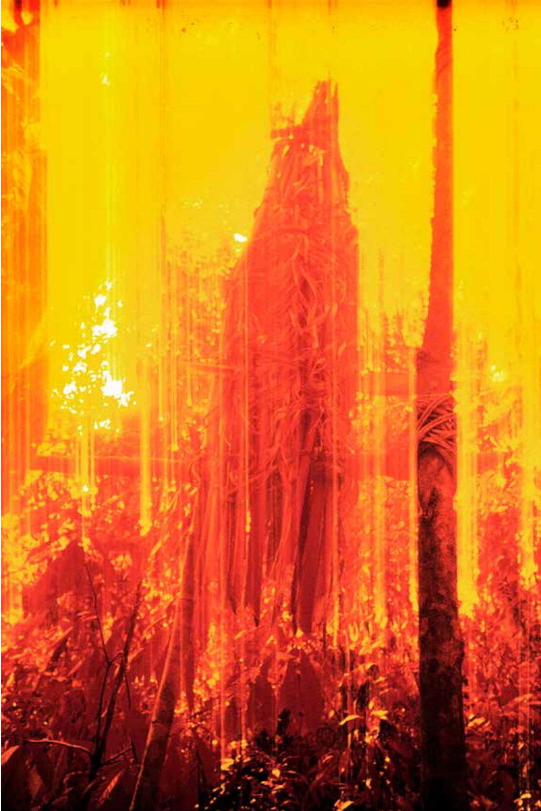
Cestos funerarios, película infrarroja. Catrimani, Roraima, 1976