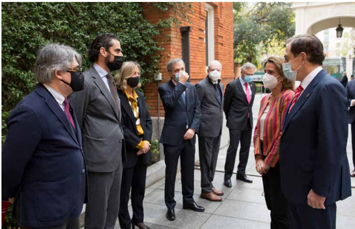
Llegada de los asistentes al acto de presentación del Centro de Investigación Ageingnomics en Madrid.