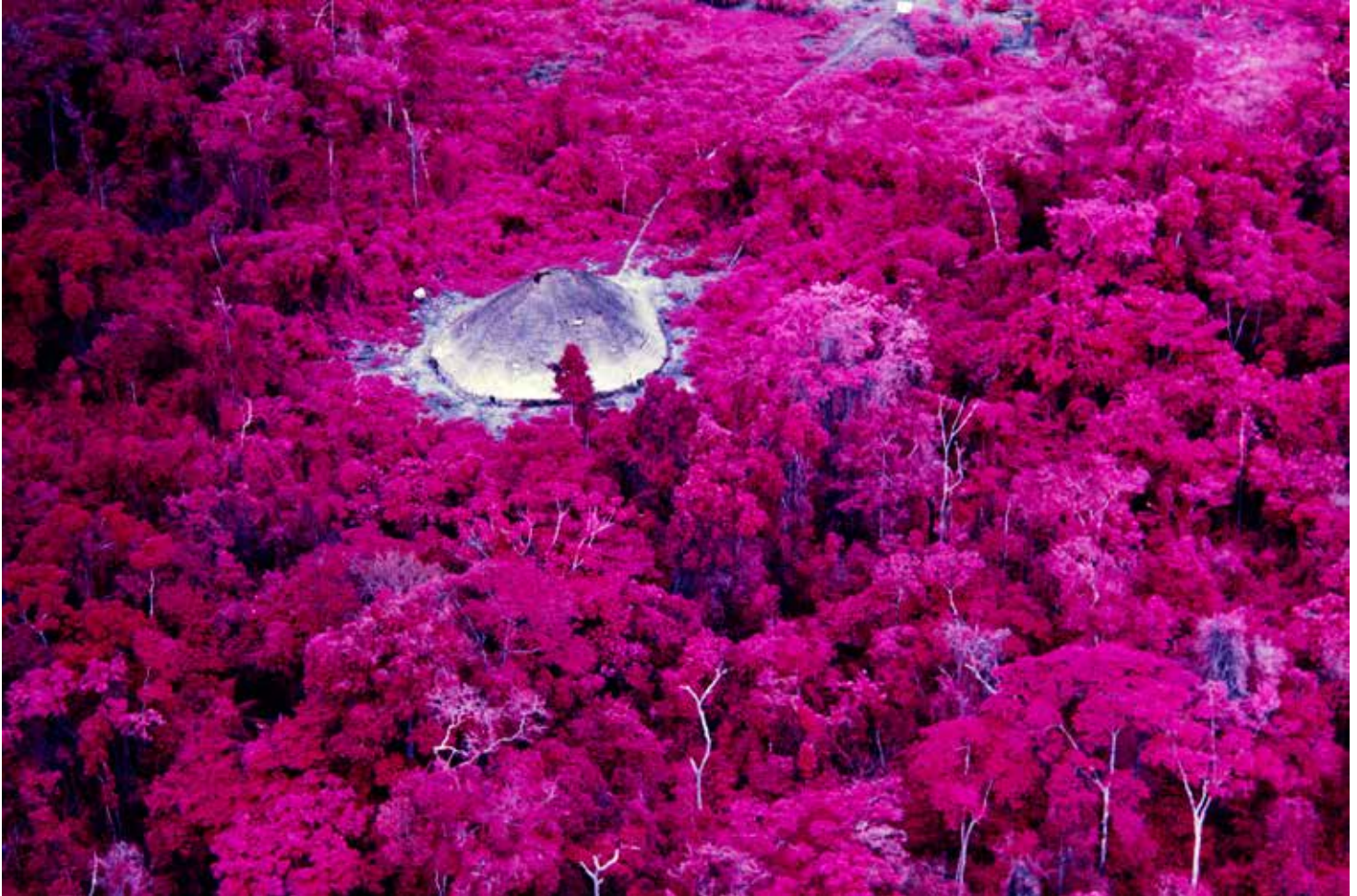
Choza cerca de la misión católica en el río Catrimani, película infrarroja. Roraima, 1976

A su vuelta a São Paulo, la artista pide una prórroga de la beca Guggenheim que había obtenido tiempo antes para abordar el proyecto de los indios xikrin y que abandona por los yanomami, y, poco después, mientras el interés de la sociedad brasileña por la Amazonia va en aumento, presenta en 1973 en el Museu de Arte de São Paulo, O homem da hileia [El hombre de la hileia]. Se trata de una pieza audiovisual con dos proyectores, un control de fusión y espejos pequeños en las lentes de los proyectores que multiplicaban el conjunto en siete