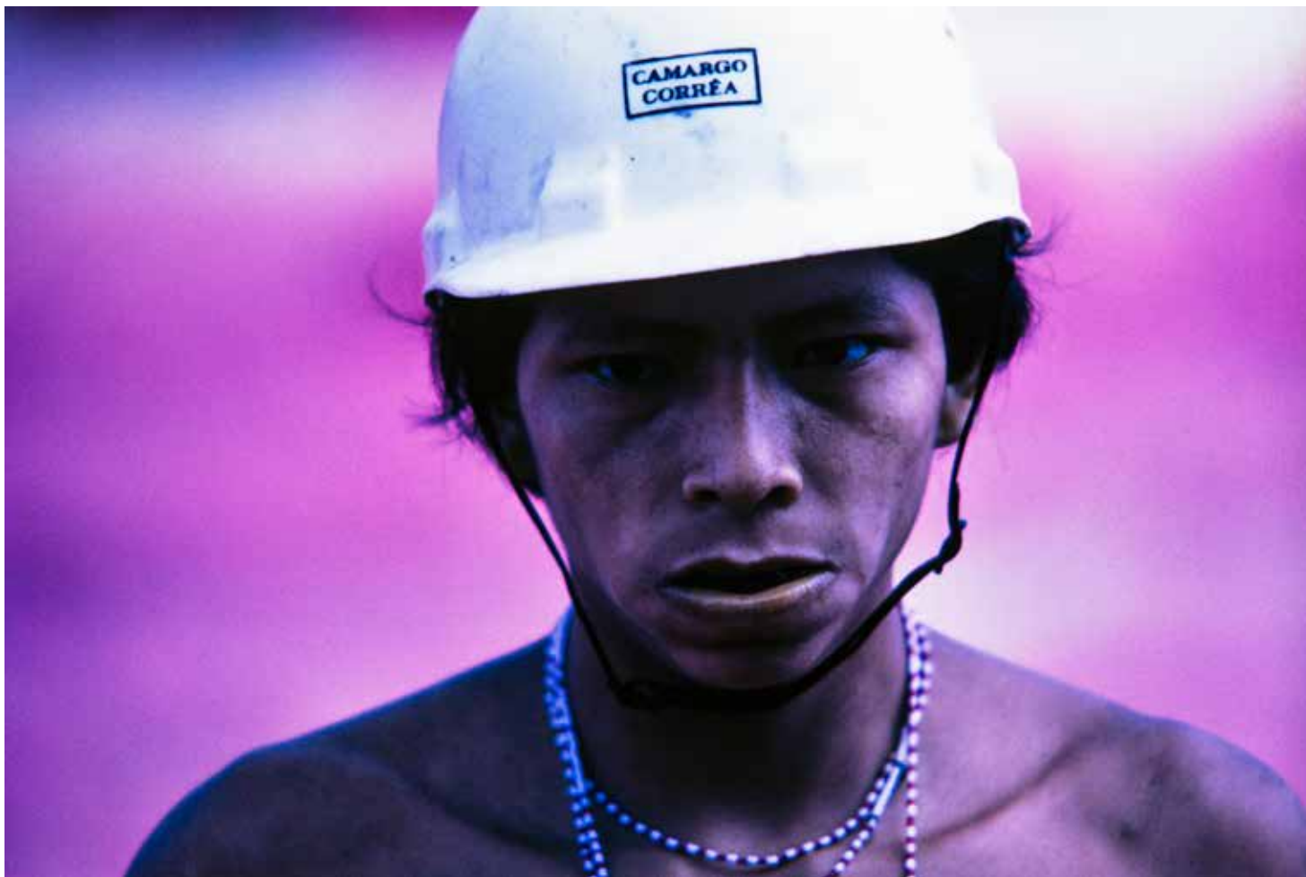
Yanomami trabajando en las obras de la carretera Perimetral Norte. Roraima, 1975

Claudia Andujar lanzó una campaña de vacunación para defender la salud de los indígenas y aprovechó para realizar numerosos retratos de cada uno de ellos