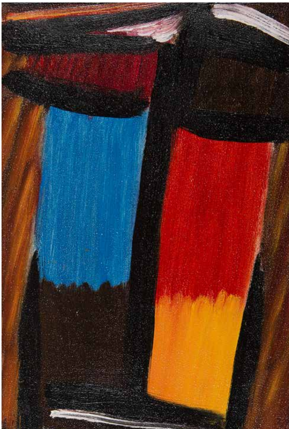
Grosse Meditation [Gran meditación], 1936 Óleo sobre cartón. 25 x 17 cm Muzeum Sztuki, Łódź

Con estas obras, Jawlensky cierra el ciclo evolutivo de su arte. Como si a lo largo de toda su trayectoria hubiera ido despojándose de cualquier anécdota narrativa y expresiva que distrajera de la esencia misma de la pintura y de la búsqueda espiritual y ascética que siempre le acompañó. ⊗