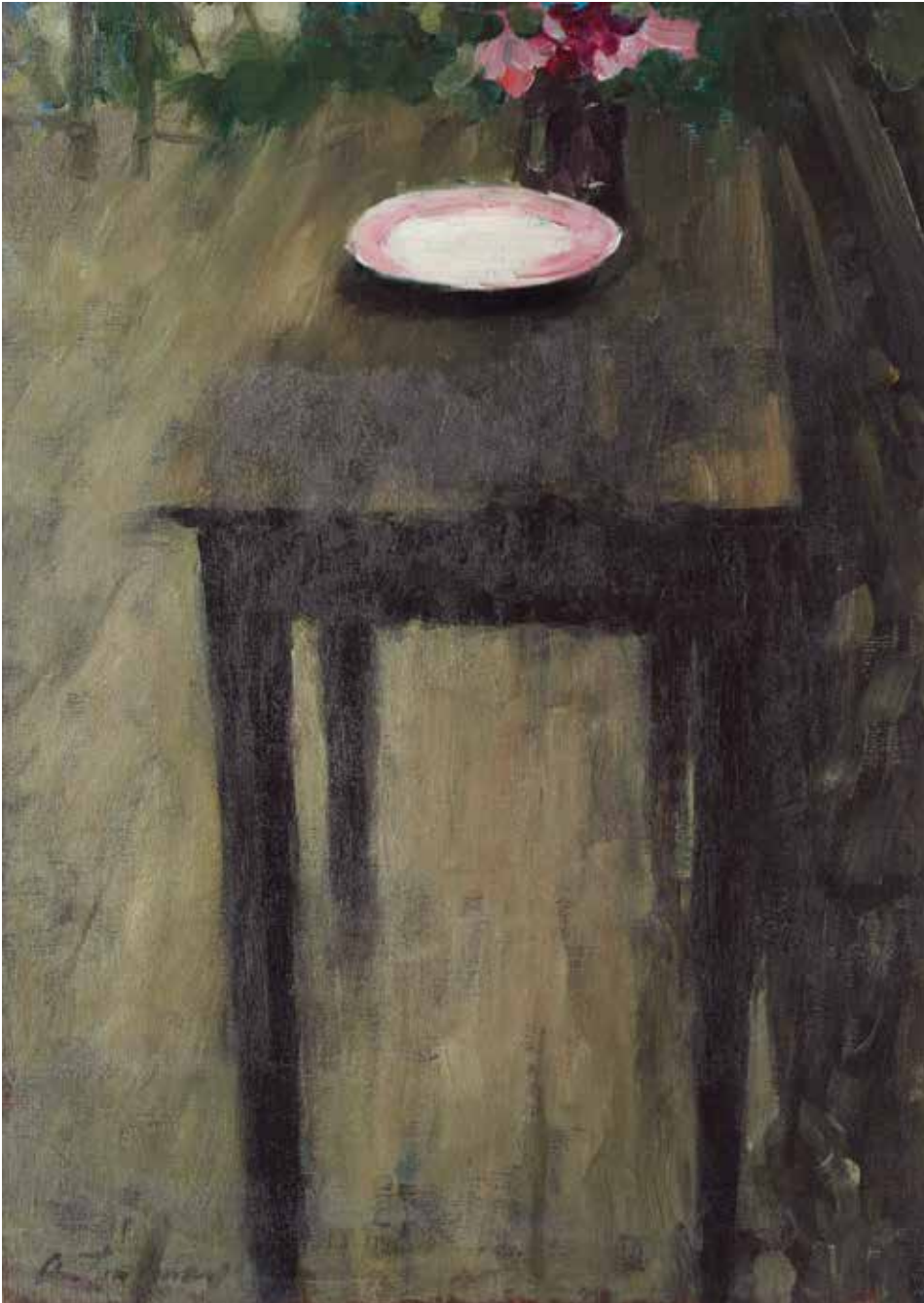
Schwarzer Tisch [Mesa negra] , 1901 Óleo sobre lienzo. 90 x 65 cm Colección particular, Suiza. En depósito en Zentrum Paul Klee, Berna

modernos, de los que partió en los inicios de su carrera y a los que volvió en sus últimas obras, las Meditaciones . La tendencia que tenemos siempre de buscar una forma humana para cualquier representación hace que el rostro sea un objeto propicio para la experimentación. Para Jawlensky, en él se reúnen lo legible y lo ilegible, lo visible y lo invisible, y así, en estos últimos, consigue unir dos ámbitos que siempre se han considerado excluyentes en la historia del arte: la figuración —el propio icono— y la ejecución formal de este, la abstracción.