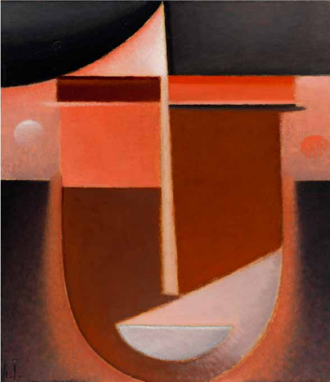
Abstrakter Kopf: Karma [Cabeza abstracta: Karma], 1933 Óleo sobre cartón adherido a madera. 42,6 x 33 cm Colección particular

Sentía la necesidad de encontrar una forma para la cara, porque había entendido que la gran pintura solo era posible teniendo un sentimiento religioso, y eso solo podía plasmarlo con la cara humana