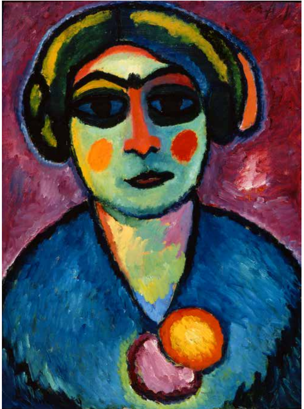
Dunkle Augen [Ojos oscuros], 1912 Óleo sobre cartón. 68 x 50 cm Colección particular

En estos rostros-óvalo, que Jawlensky inicia en 1918 y en los que trabaja ininterrumpidamente hasta 1935, los ojos aparecen ya sellados. Es la primera vez que hace una serie de pinturas en las que no están presentes los ojos abiertos, como si el artista —y también el propio rostro representado— estuviera mirando hacia dentro,