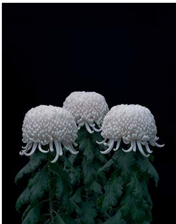
Tomoko Yoneda Chrysanthemums [Crisantemos], 2011 ©TOMOKO YONEDA. CORTESÍA DE LA ARTISTA