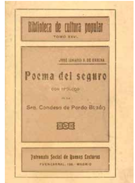
Museo del Seguro. Fundación MAPFRE

Mario Benedetti (1920-2009), escritor y periodista uruguayo de la generación del 45, autor de más de 80 obras, algunas de ellas traducidas a 20 idiomas, escribió este original poema dentro de su poemario Letras de emergencia . Escrito entre 1969 y 1973, en él menciona, curiosamente, tanto a las pólizas como a los corredores de seguros. ✕