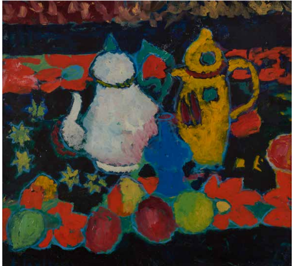
Stilleben mit gelber und weisser Kanne [Naturaleza muerta con teteras amarilla y blanca], 1908 Óleo sobre cartón adherido a madera. 49,6 x 53,8 cm Colección particular, Suiza. En depósito en Zentrum Paul Klee, Berna

La exposición ofrece un amplio recorrido cronológico por la trayectoria del pintor y establece un diálogo con piezas de distintos artistas que tuvieron influencia sobre él, entre los que destacan André Derain, Henry Matisse, Marianne von Werefkin o Gabriele Münter