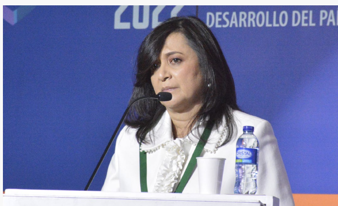
↑ Myriam Stella Gutiérrez, magistrada en la Sección Cuarta del Consejo de Estado