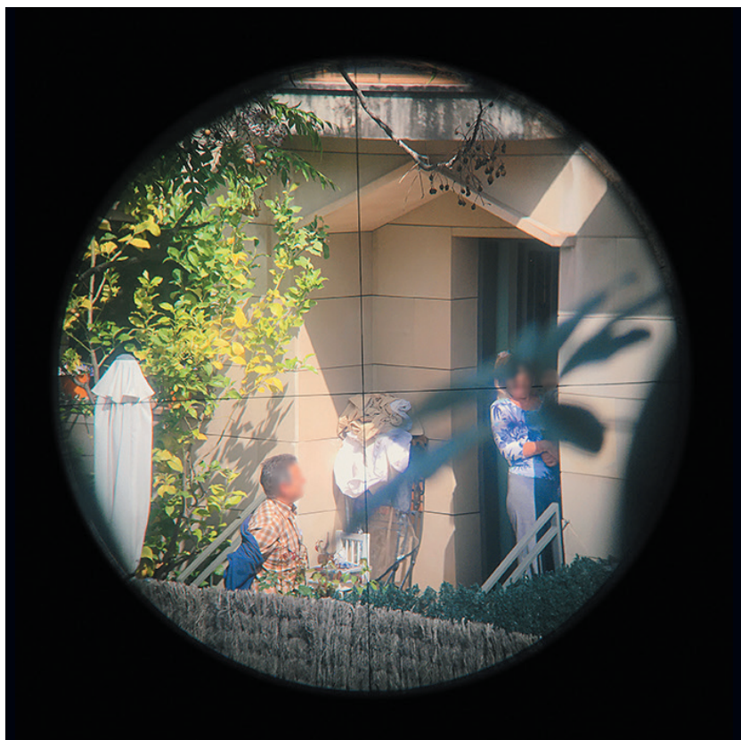
BLANCA MUNT, serie Alerta Mira-Sol , 2019

Alerta Mira-Sol se inicia en 2019 cuando la fotógrafa Blanca Munt pasa a formar parte de un chat de vecinos creado para vigilar su barrio y alertar de posibles robos en domicilios u otros sucesos sospechosos. Con la mirada puesta, por un lado, en la realidad cotidiana del barrio y, por otro, en el comportamiento del grupo, la autora dibuja un retrato de Mira-Sol, de sus diferentes personajes —vecinos, sospechosos, policía, administradores locales— y situaciones, con el que consigue apelar de lleno a nuestros propios miedos y contradicciones. El proyecto se alimenta de diversas fuentes, como los textos del chat, las fotografías que la autora realizó en el barrio y las que hizo desde su casa con un telescopio, y los símbolos que los ladrones utilizan para marcar las casas. En las propias palabras de Munt, Alerta Mira-Sol es una “reflexión acerca de la tensión entre el privilegio de vivir en un lugar apacible y la constante sensación de amenaza latente como parte de la actual cultura del miedo”.