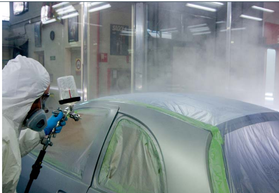
La actividad del taller genera distintos tipos de contaminantes atmosféricos.

o dificulten su posterior gestión. Por eso, los envases y sus cierres deben estar en perfectas condiciones, ser resistentes a la naturaleza del contenido y que no formen con él combinaciones peligrosas. Sobre ellos figurará de forma visible una etiqueta (tamaño mínimo de 10 x 10 cm) que indique clara, legible e indeleblemente su contenido, el código de identificación del residuo, la naturaleza de los riesgos que presenta (pictogramas y/o frases R, aquellos enunciados que especifican la naturaleza de los riesgos de las sustancias químicas y preparados