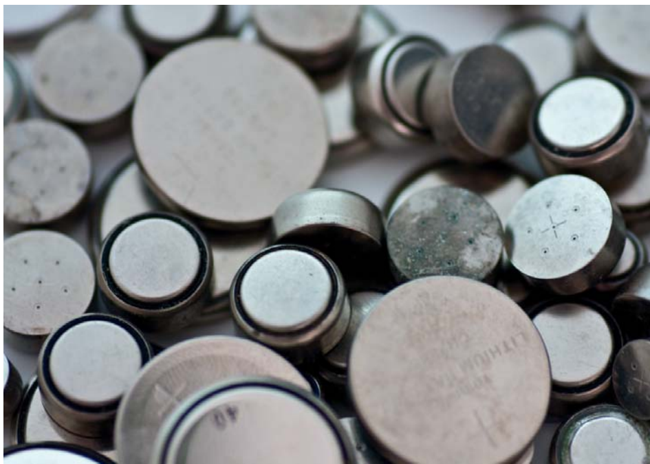
Existen sistemas integrados de gestión también para las pilas botón.

A los talleres y personal técnico que trabajan con sistemas de climatización de vehículos cuyos refrigerantes están basados en gases fluorados, como el R134a, o en sustancias que agotan la capa de ozono, como el R12, les es de aplicación la correspondiente normativa; esta exige obligaciones para la certificación del personal que instale, mantenga o revise estos sistemas; incluido el control de fugas, la carga y la recupera-