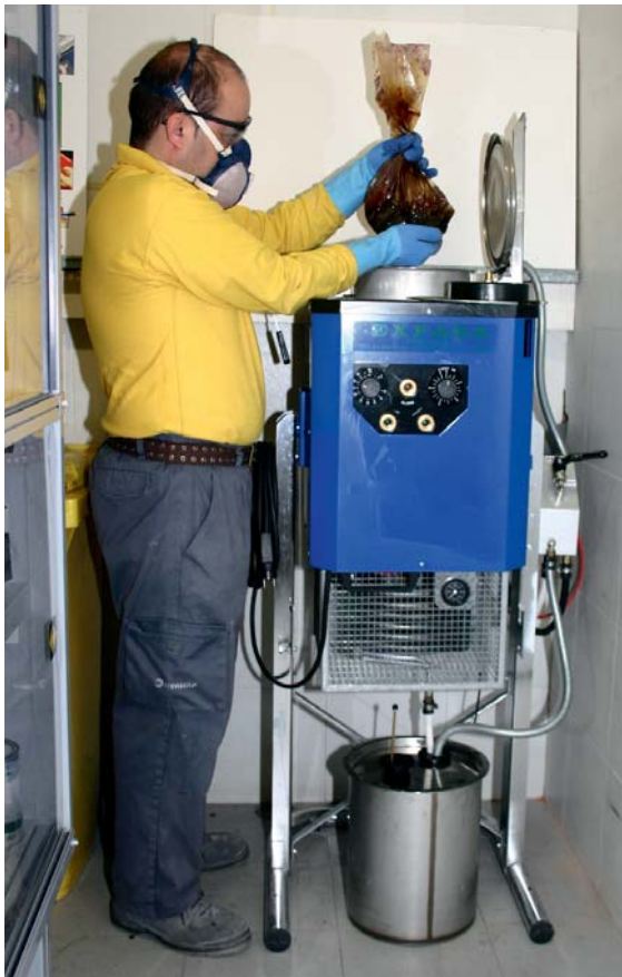
Los lodos de la recuperación de disolvente usado en pintura son residuos peligrosos.

Cuando un suelo ha sido declarado contaminado, se obliga a realizar las actuaciones necesarias para su limpieza y recuperación ambiental, en los términos y plazos que dicta el órgano competente de su comunidad autónoma. Esta obligación recae sobre los causantes; si son varios responderán de forma solidaria y subsidiariamente, por este orden, los propietarios de los suelos contaminados y sus poseedores. El Real De-