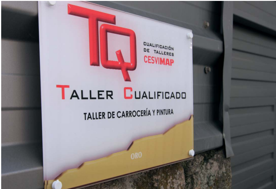
Los talleres deben demostrar su cualificación aplicando las mejores técnicas medioambientales.