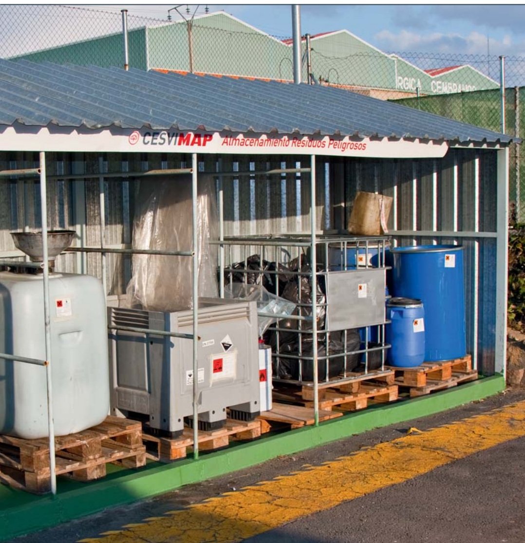
El almacén de residuos peligrosos debe estar debidamente protegido.

residuos no peligrosos-. Esta comunicación contendrá la información del anexo VIII de la Ley 22/2011, dando lugar a su inscripción en el «Registro de producción y gestión de residuos» que cada comunidad autónoma mantiene actualizado.