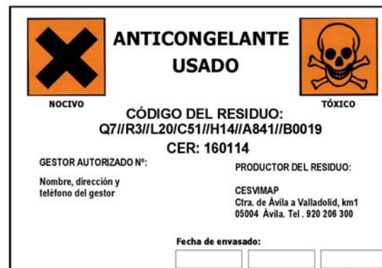
Etiquetado correcto del residuo.

Antes de comenzar sus actividades, el taller debe comunicarlo al órgano competente de su comunidad autónoma—requisito aplicable a todos los productores de residuos peligrosos, o que generen más de 1.000 toneladas anuales de