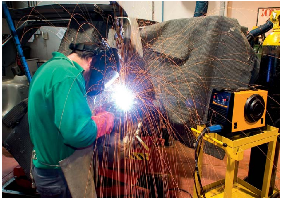
La reparación de carrocerías conlleva posible contaminación por ruido o vibraciones.

Debe instalarse una arqueta para tomar las muestras para el análisis de las aguas. Los límites aplicables a los con-