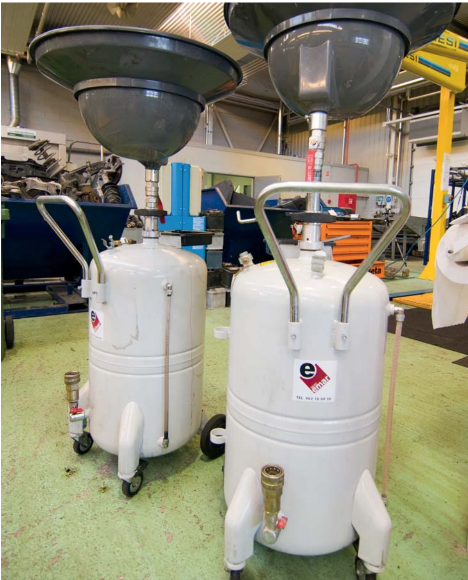
La separación de los residuos evita mezclas peligrosas.

Además de la ley genérica de residuos y de los reglamentos de desarrollo, una amplia normativa puede afectar a los talleres de reparación de vehículos, según las sustancias que manipulan y el tipo de residuos que producen (anexo legislativo).