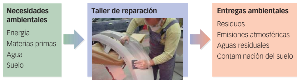
Tabla 1. Repercusiones ambientales de la actividad de los talleres.