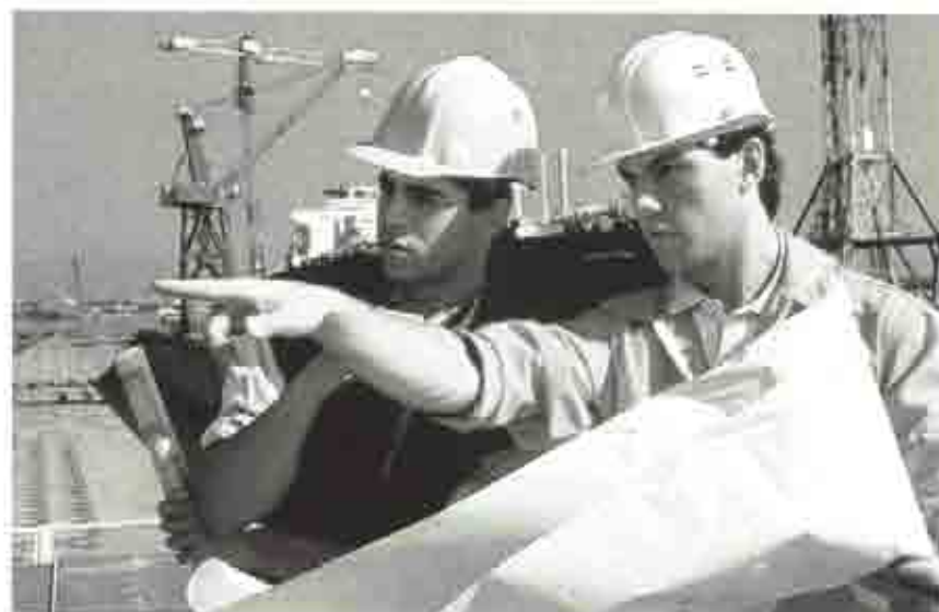
Los comités de Seguridad e Higiene están facultados para realizar visitas a los lugares de trabajo.

Este aserto se refuerza, en nuestra opinión, si analizamos el apartado 3 del artículo 8º, que enumera las funciones de los Comités de Seguridad e Higiene en el Trabajo, que establece la facultad de «realizar visitas, tan-