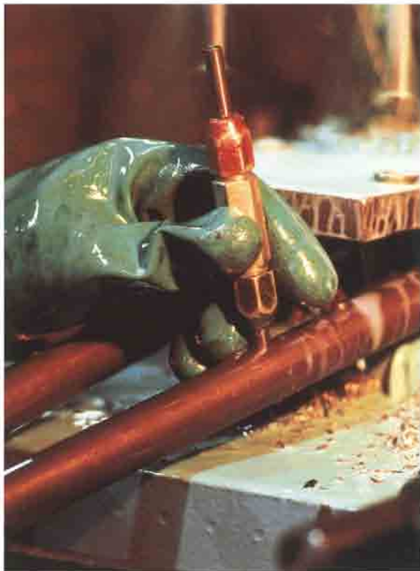
En la futura Ley de Prevención de Riesgos Laborales también se contemplan auditorías técnicas de Higiene Industrial.

Podemos afirmar, pues, que la cobertura legal de las «auditorías técnicas de seguridad e higiene» está ahora suficientemente explícita en los textos legales de esta clase, y que esto es especialmente cierto en materia de higiene industrial, dado que los Reglamentos a que hemos aludido (amianto, plomo, ruido, etc.) pertenecen al área técnica de la higiene industrial, dentro del más amplio con-