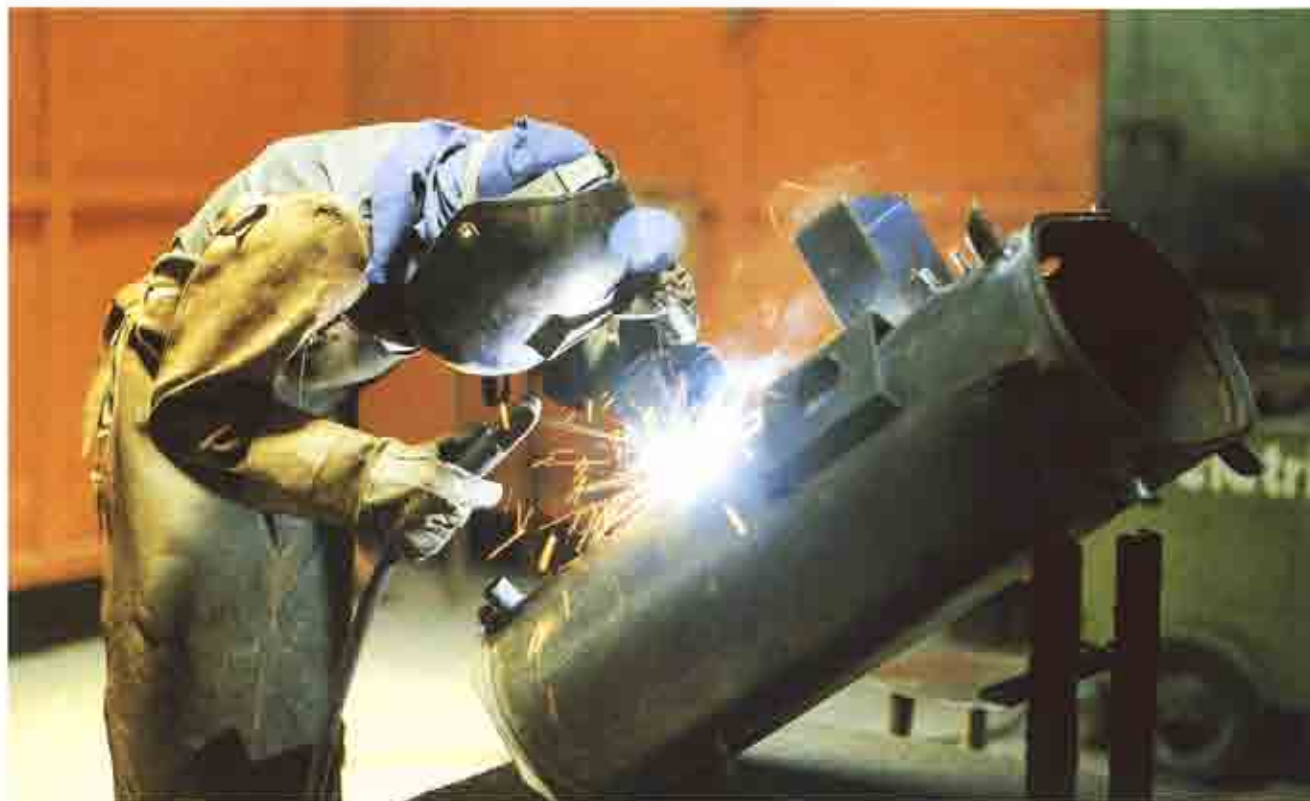
Es obligación del empresario proveer cuanto fuese preciso de herramientas, material y útiles de trabajo en las debidas condiciones de seguridad.

Se puede afirmar que la cobertura legal de las auditorias técnicas de seguridad e higiene está hoy en día suficientemente explícita en los textos legales de esta clase.