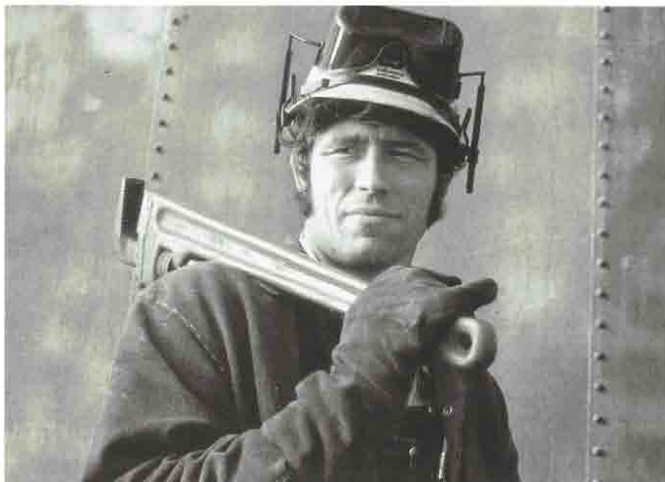
El trabajador tiene derecho a una protección eficaz en materia de seguridad e higiene.

cial general, caben así, y obligadas por la legislación, «auditorias» técnicas de higiene industrial, de medicina laboral y de seguridad en el trabajo strictu sensu .