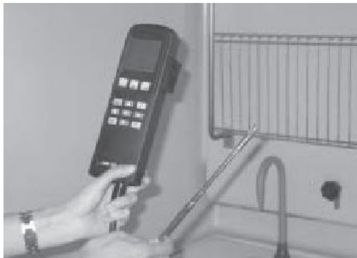
Figura 3 Lectura con anemómetro en el punto de medida