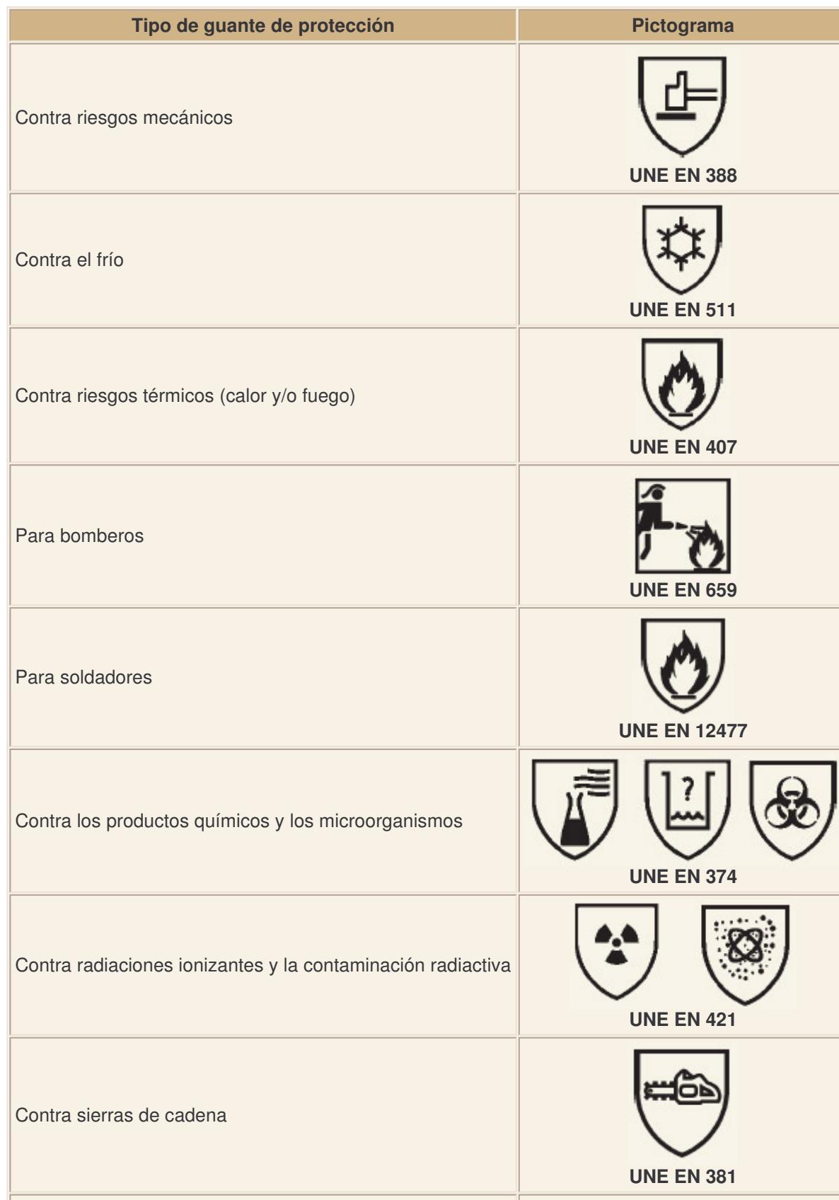
Tabla 1 Tipos de guantes de protección y sus pictogramas correspondientes

En la tabla 1 se enumeran las normas específicas de guantes de protección, así como los pictogramas asociados. Estos pictogramas irán acompañados de unos números que representan los niveles de prestación obtenidos de acuerdo a la norma específica.