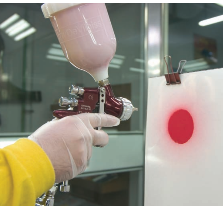
Abanico cerrado, a la izquierda, y abierto a tope, a la derecha

En cambio, productos menos viscosos requieren picos de menor tamaño. Para las pistolas híbridas es habitual que se ofrezcan distintos tipos de casquillos, adecuados a los diversos productos, normalmente uno para pinturas de baja viscosidad como la base agua, otro para