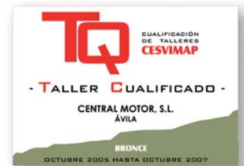
Placas identificativas exteriores de los talleres TQ